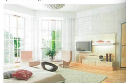
Heimtextilien mit NanoSphere®-Technologie

dem neusten Stand der Technik und ökologisch unbedenklich ist – auch wenn das Endprodukt später entsorgt wird.