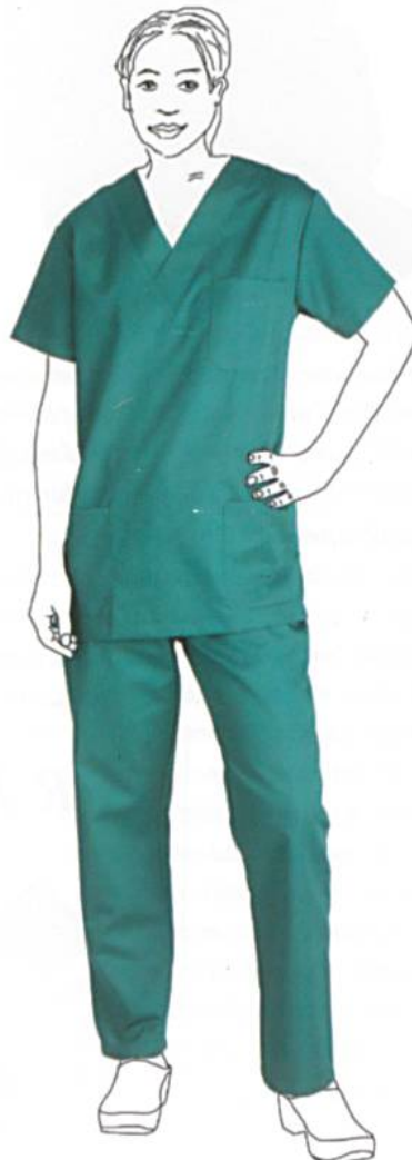
Abb. 1: OP-Bereichsbekleidung von Dieckhoff aus Eschler Kasackstoff