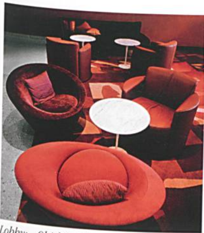
Lobby: Objekttextilien mit NanoSphere®-Technologie

abweisende Funktion von NanoSphere® noch immer auf einem Top-Niveau, während eine vergleichbare, handelsübliche Textilausrüstung bereits nach einer Belastung mit 5'000 Touren fast auf einen 0-Wert sinkt. Ein anderes Merkmal für die Langlebigkeit zeigt sich beim Regentest nach Bundesmann [2]). Nach 10 Minuten Dauerberegnung mit simulierten 100 Litern Wasser auf ein 1 m 2 grosses Stoffstück weist NanoSphere® immer noch einen Wert von 4 (Maximum = 6) auf, während ein handelsübliches Produkt nur noch auf einen Wert von 1 kommt. Für den relativ jungen Markt der Heim- und Objekttextilien haben Schoeller und Clariant viele Versuche und Tests gefahren und inzwischen einige wenige Firmen lizenziert.