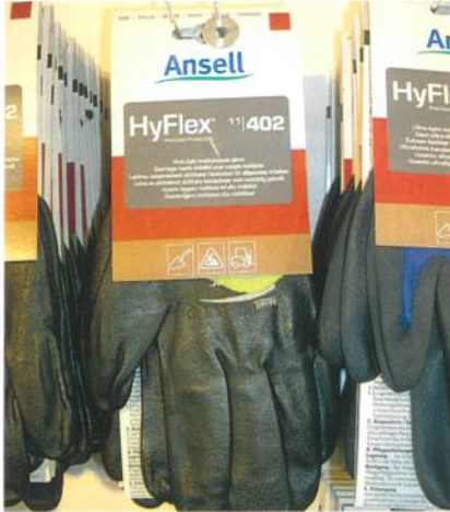
Abb. 2: Etikett mit dem geänderten Preis drucken und auf dem Artikel anbringen

ändern sich die Preise automatisch im System. Die Informationen werden kontinuierlich aktualisiert und sowohl die Filiale als auch die Zentrale können in Echtzeit darauf zugreifen.