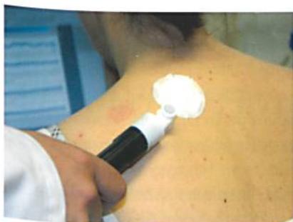
An den Hohenstein Instituten wurde die Freisetzung von Wirkstoffen aus den Nanosol modifizierten Wundauflagen u.a. auch an Probanden (in vivo) untersucht

sonderes Aussehen haben wir auch mit unseren Projekten zur Biotherapie erregt, wie z. B. Wundauflagen, bei denen Bakteriophagen oder der Extrakt der Goldfliege die Heilung chronischer Wunden beschleunigen.