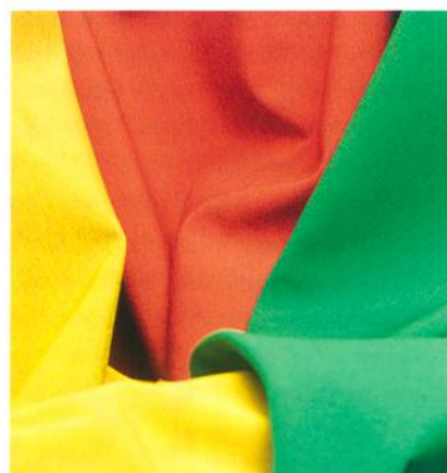
Abb. 2: Elegante Melange mit viel Funktion

pathisch. Die Farbpalette zeigt sich recht naturnah mit zahlreichen steinernen Grauvarianten bis hin zu leicht schmutzigerdigen Pastelltönen. Wer es sehr weich und reichlich voluminös mag, findet in der schoeller®-WB-400-Reihe weitere ultrafein strukturierte Ripstops mit flauschigem Fleeceinterieur. Die bi-elastischen Jacken- und Hosen-Qualitäten in neutralem Schwarz oder warmem Maisgelb sind für viele Wintersportarten ideal. Eine leichte, querelastische WB-400-soft-shell mit deutlich grösserem Ripstop-Raster eignet sich ausserdem hervorragend für Outdoorjacken.