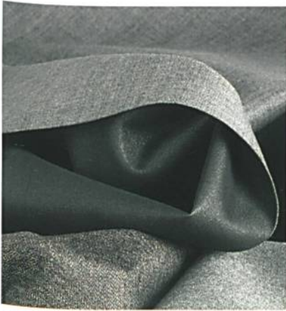
Abb. 4: schoeller®-naturetec-soft-shell

der neuen Kollektion zeigt Schoeller deshalb beispielsweise aparte Lifestyle-schoeller®-WB-400-soft-shells aus Baumwolle-Wolle-Mischungen im klassischen Mouliné-Look und mit wärmender