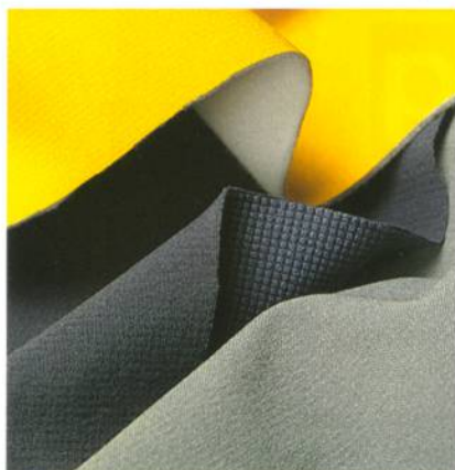
Abb. 1: Bärenstark durch Ripstop

Stoffe mit einer Ripstop-Struktur sind für ihre besonders hohe Reiss- und Weiterreissfestigkeit bekannt (Abb. 1). Schoeller nutzt diese Webtechnik für die neuen schoeller®-dryskin-Gewebe mit angedeuteter Karooptik auf der Gewebeeoberfläche, die durch eine dreidimensionale Mini-Ripstop-Struktur auf der Gewebeeinnenseite geschaffen wird. Solche Hosenqualitäten halten bei reduziertem Gewicht viel aus und sind hautsym-