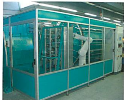
Abb. 1: Das CTM-System im Einsatz an der Gir-O-Matic

Die Optimierung spezifischer Abläufe, wie der Materialbestückung mit Hilfe eines Roboters,