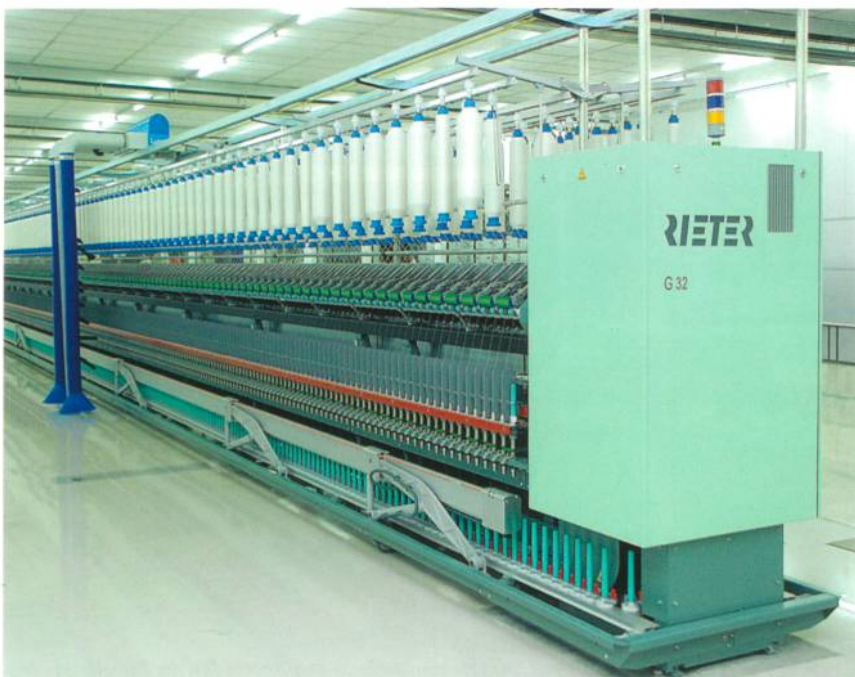
Abb. 1: Ringspinnmaschine G32

72 kg/h Kammzug – das ist die reale Leistung der halbautomatischen Kämmaschine E 66 (Abb. 2). Ihre Entwicklung basierte auf der Basis der jahrelangen Erfahrungen auf dem Gebiet des Kämmens, mit mehr als 7'800 verkauften Maschinen. Zusammen mit dem Computer-Aided-Process-Development – C•A•P•D500 – wurde der Kämmprozess hinsichtlich Bewegungsablauf, Belastung der Arbeitswerkzeuge sowie Luft- und Energieverbrauch optimiert. Die hohe Leistung von 72 kg/h wird unter einem idealen Laufverhalten und höchster Qualität bei 500 Kamm-