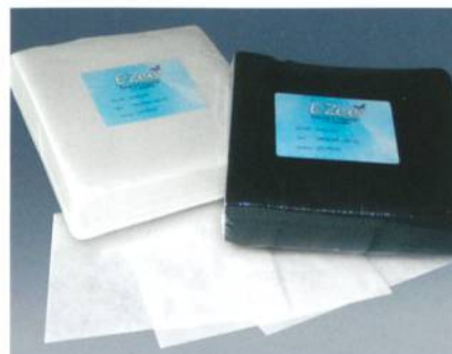
Abb. 1: E-ZEE Weblon, extrem hitzebeständiges Vlies in praktischen Zuschnitten, ideal für Maschenware

E-ZEE Weblon ist ein strukturiertes, angenehm weiches Schneidevlies, welches in weiss und schwarz lieferbar ist. Die Maschenwareprodukte sind mit normalen Vliesstoffqualitäten verstickbar. Reissvliesstoffe machen oft den Erfolg, eine dezente Stickerei faltenfrei aufs Shirt gebracht zu haben, beim Entfernen des Vliesstoffes wieder zunichte. Die bessere Alternative ist deshalb ein sauber um die Stickerei ausgeschnittener Vliesstoff, wie Weblon. Ein Vliesstoff, der auch nach dem Waschen eine bleibende Stabilität gewährleistet.