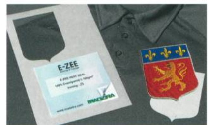
Abb. 2: E-ZEE Heat Seal – zuerst im passenden Zuschnitt mit dem Wappen verkleben

Es gibt jetzt auch für andere Aufgabenstellungen einen Standardvliesstoff von 40 g/m 2 aus 100 % Viskose. Es ist ein Reissvliesstoff, in der praktischen Zuschnittgrösse von 20 x 20 cm. Da er zu den Vliesstoff-Allroundern gehört, bietet Madeira ihn im 1'000er-Vorteilspack an. Sie werden es erleben – die Zuschnitte erleichtern Ihnen die Arbeit – also fangen Sie doch am besten gleich damit an.