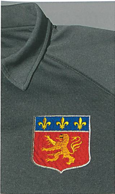
Abb. 3: Nach der Entfernung des Kleber-Schutzpapiers auf das Fertigteil verkleben

Seal ist in zwei Qualitäten – eine Bügel- und eine Thermopresse-Version – lieferbar. Den Arbeitsablauf zeigen die Abb. 2 und 3. Das Wappen wird passend mit E-ZEE Heat Seal verklebt. Nach der Entfernung des Schutzpapiers lässt sich das Wappen auf das Fertigteil kleben.