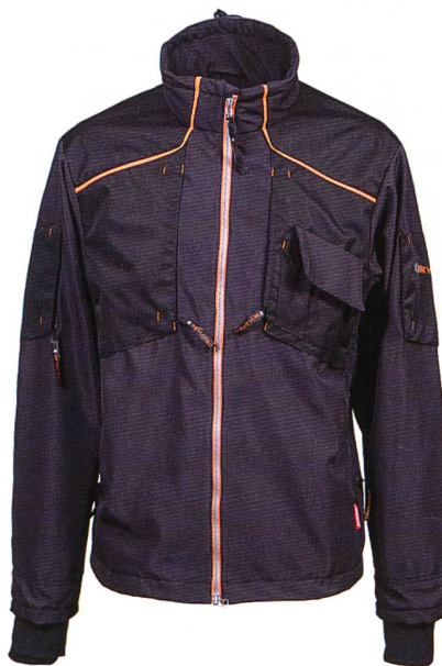
Abb. 3: Die Workwear Jacke von SKYLOTEC besitzt auffällige orange Reflektspaseln für eine optimale Sichtbarkeit

Wind, Regen, Kälte – wer kennt das nicht! Gerade bei Arbeiten im Freien wie beispielsweise auf Baustellen oder Windanlagen kann schlechtes Wetter