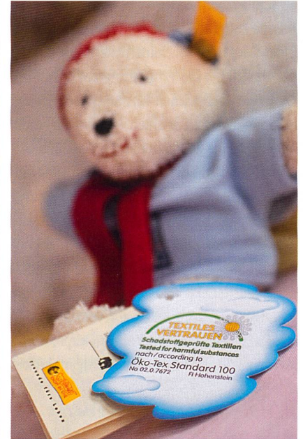
Abb. 3: OEKO-TEX® Standard 100 – Schadstoffprüfungen stehen bei Millionen textiler Produkte für humanökologische Sicherheit, Bild: OEKO-TEX®

steht, ist sicherlich in erster Linie darin begründet, dass das System von Anfang an international ausgerichtet war und eine grosse Transparenz für alle Beteiligten bietet (Abb. 3). Der Bekanntheits-