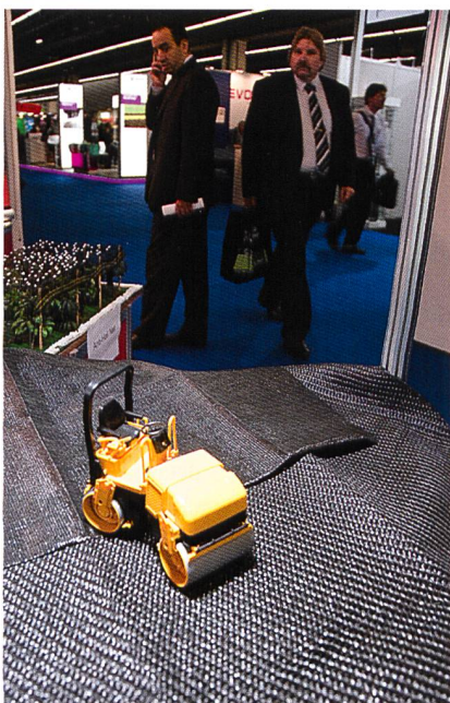
Abb. 3: Geotech und Landschaftsschutz

Der Körper erkennt diese neue Prothese als körpereigen, und Abwehrreaktionen wären damit vermieden.