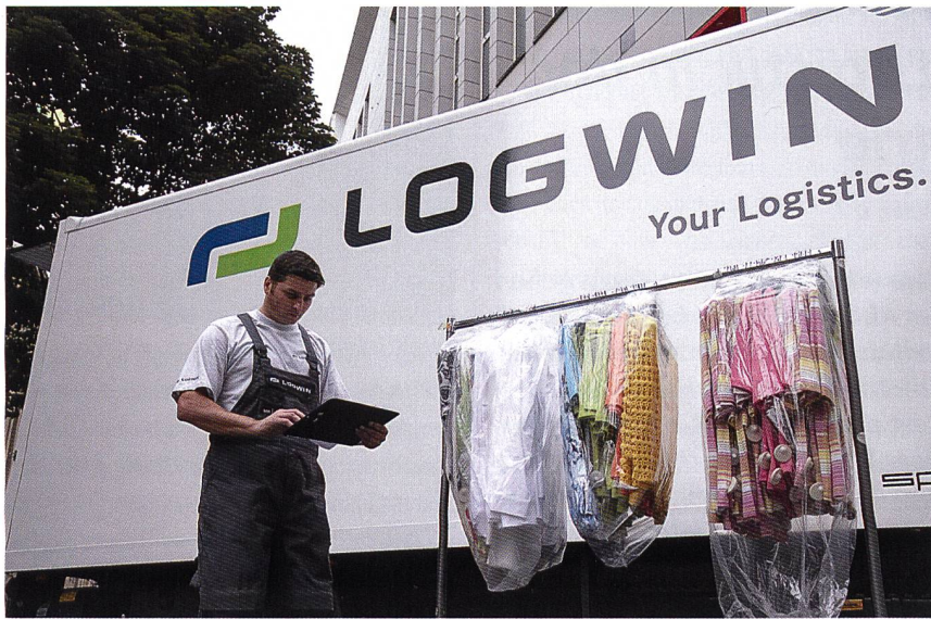
Abb. 2: Distribution: Logwin fashion-x-press

dukte, wie T-Shirts, die in grosser Menge gefertigt werden, werden nach wie vor bündelweise von Nähstation zu Nähstation geführt. Die Grösse der Bündel hängt davon ab, wie viele Lagen Stoff in einem Zuschnitt-Vorgang geschnitten werden. Eine Maximierung durch Kompaktierung der Stofflagen mittels Unterdruck ist seit vielen Jahren üblich. Nach wie vor üblich sind die rollbaren Böcke, auf denen auch grössere Teile wie Hosen, Jacken oder Mäntel durch den Produktionsprozess manuell bewegt werden.