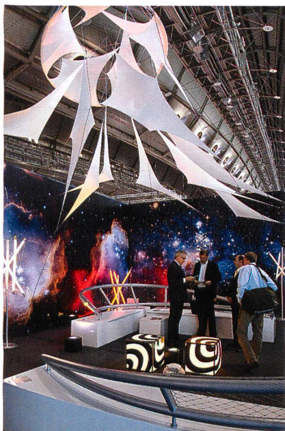
Abb. 2: Textile Spanntechnik, Firma: Leichtbaukunst, Jens J. Meyer, Quelle - Messe Frankfurt Exhibition GmbH / Jean-Luc Valentin

Im Bereich der modernen Medizin wurde jüngst beim Innovationswettbewerb Medizintechnik des Bundesministeriums für Bildung und Forschung (BMBF) die Idee zur Entwicklung einer zellbesiedelten gestenteten Herzklappenprothese auf der Basis von synthetischen Polyurethan-Zellträgern prämiert. Dazu soll eine synthetische, nicht resorbierbare Vliesstoffstruktur in Form einer Taschenklappe mit körpereigenen venösen Zellen besiedelt werden.