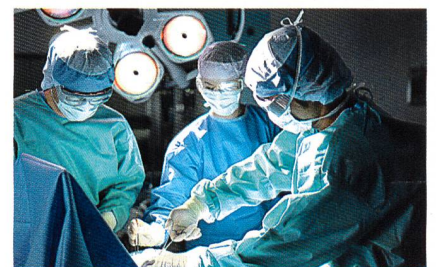
Abb. 1: Stoffe mit «Wohlfühlklima» für den Körper

die Aussenseite transportierte Feuchtigkeit verbleibt zwischen dem OP-Mantel und der Unterbekleidung, da die wasserabweisende Ausrüstung ein «Zurückfließen» der Feuchtigkeit auf die Haut verhindert. Der Chirurg fühlt sich trocken und somit «wohl in seiner Haut» (Abb. 1).