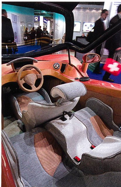
Abb. 4: Sitzformteile tragen zur Gewichtseinsparung im Automobilbau bei

auf 30-35 Kilogramm erhöhen. Anteilig werden davon 50-60 % Vliesstoffe sowie Filze und 40-50 Prozent andere textile Flächengebilde sein. Experten gehen davon aus, dass zudem der Einsatz von Naturfasern bzw. Fasermischungen in