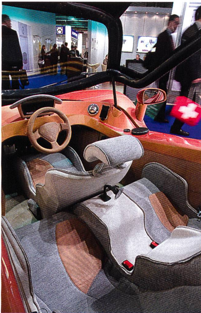
Abb. 4: Sitzformteile tragen zur Gewichtseinsparung im Automobilbau bei auf 30-35 Kilogramm erhöhen. Anteilig werden davon 50-60 % Vliesstoffe sowie Filze und 40-50 Prozent andere textile Flächengebilde sein. Experten gehen davon aus, dass zudem der Einsatz von Naturfasern bzw. Fasermischungen in

der PKW-Produktion zunehmen wird. Nicht zuletzt vor dem Hintergrund der Recyclingfähigkeit ist deren Einsatz sinnvoll. Darüber hinaus sind Naturfasern wesentlich leichter als Chemiefasern, was zu einer Gewichtsersparnis von bis zu 40 % pro PKW führen kann (IVGT, 2010). Deutschland gilt als «Lead Market» in diesem noch jungen Segment.