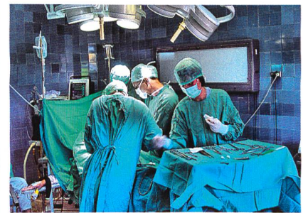
Abb. 1: Eschler-Maschenstoffe für OP- und Bereichsbekleidung

Eine Weltneuheit präsentierte die Christian Eschler AG mit einer flammhemmenden Maschenware aus einer einzigartigen Kombination von Aramid- und PTFE-Garnen, welche bezüglich Feuchte- und Schweißregulation ebenso gut abschneidet wie der identische Stoff aus 100% Polyester (Abb. 2). Dieser innovative Maschenstoff ist eine Weiterentwicklung des für die Schweizer Armee konzipierten Sweatmanagement-Systems als flammhemmende Version. Bereits vor zehn Jahren sorgte der Maschenprofi in Zusammenarbeit mit der Schweizer Armee und dem bekannten Prüfinstitut EMPA mit der Entwicklung des Sweatmanagements für viel Aufsehen. Mit dem optimal aufeinander abgestimmten Bekleidungssystem werden die Körperwärme sowie überflüssiger Schweiß in Dampfform über