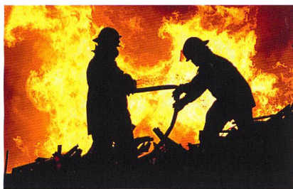
Abb. 2: Flammhemmende Eschler-Stoffe – wenns heiss wird....

vermehrt mit hochbrennbaren Wurfgeschossen in Kontakt kommen könnten. Eine Nachfrage besteht aber auch in anderen Bereichen, wie Unterwäsche für die Formel 1 sowie für Piloten von Kampffjets.