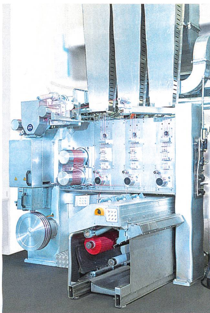
Abb. 2: Die BCF-Anlagengeneration S+

Der führende Anbieter in der Herstellung hoch entwickelter BCF-Teppeichgarne zeigt seine technologische Leistungskraft mit der Anlagengeneration S+. Diese BCF-Maschine vereint alle Vorzüge bisheriger Technologien, wie Sytec One oder S5, und bietet zudem eine deutlich höhere Prozessgeschwindigkeit und eine Leistungsfähigkeit von bis zu 99 Prozent (Abb. 2). In der synthetischen Stapelfaser-Herstellung bietet Oerlikon Neumag die Anlage mit der weltweit grössten Kapazität einer einzelnen Linie: Die 300-Tagestonnen-Anlage zur Herstellung von Polyester-Stapelfasern senkt die Betriebs- und Produktionskosten pro Tonne deutlich und ist bereits im Markt platziert. Auf dem Messe-Menü stehen auch Schlüsseltechnologien zur Herstellung von Nonwovens: Der Focus liegt hier auf Anwendungen wie Filtration, Geotextilien und anderen technischen Applikationen.