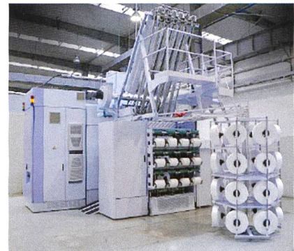
Abb. 1: Die neue automatische Texturiermaschine eFKA

Der Remscheider Marktführer für Filamentmaschinen und -anlagen hat das Nonplusultra für das Texturieren im Blick und zeigt die neue automatische Texturiermaschine eFKA (Abb. 1). Das Messe-Highlight kombiniert Bewährtes aus den etablierten eFK, AFK- und MPS-Baureihen