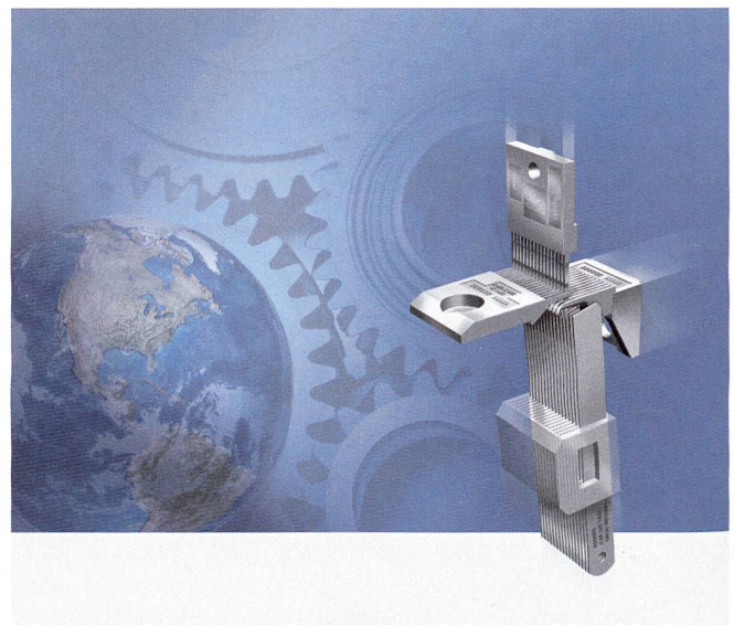
Abb. 1: Prozesssicherheit durch funktionales Zusammenspiel