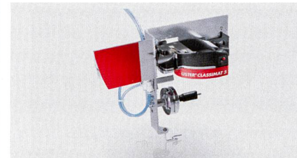
Abb. 2: USTER® CLASSIMAT 5 Messkopf am Befestigungsmodul

Neben der gesamten Palette an Qualitätsmessdaten, die der USTER® CLASSIMAT 5 bestimmen kann, steht nun ein zusätzliches Analysewerkzeug zur