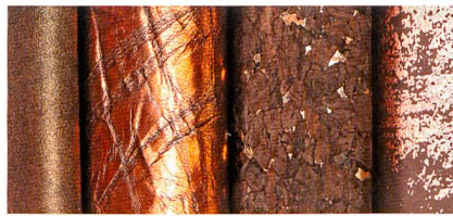
Abb. 5: The geologist – rustikal und erdig

Dinge zu entwickeln, die das Leben spannend machen – hier sieht the inventor seine Herausforderungen. Er arbeitet an Konzepten, die Funktion und Spass sowie Wellness und Genuss vereinen. Seine Sehnsucht führt ihn zu unentdeckten Welten voller Wunder und Abenteuer. Er probiert Neues aus, was massgeblich die Gestaltungsprozesse prägt. Stoffe werden buchstäblich zum Leben erweckt: Sie schlingern, flattern und wachsen als blumige Ornamente – äusserst sinnlich und