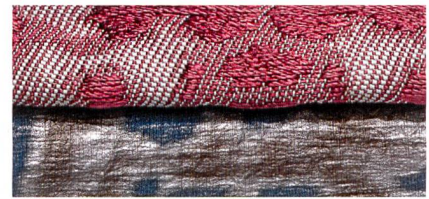
Abb. 6: The geologist – geheimnisvoller Glanz

Der Naturliebhaber schätzt und schützt die Erde mit all ihren Kostbarkeiten. Er erforscht sie bis in die tiefsten Schichten und begibt sich auf Entdeckungsreise nach dem Unbekannten und Unerwarteten. Er weiss um die Qualität und die