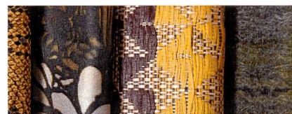
Abb. 3: The eccentric – zeitlose Qualität mit dekorativem Charakter

volle Orientierung sowie zuverlässige Aussagen. Im jährlichen Wechsel zeichnet ein anderes Mitglied für die Ausführung der Heimtextil Trends verantwortlich. Zur Saison 2013/2014 verleiht ihnen das Stijlinstituut Amsterdam Name und Gestalt.