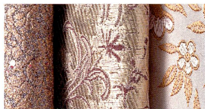
Abb. 2: The historian – Gold und Brokat

Als weltweit grösste Fachmesse für Wohn- und Objekttextilien kommt der Heimtextil eine besondere Funktion als Trendbarometer und Masseinheit für Qualitätstextilien mit Design und innovative Funktionalität zu. Daher hat die Messe Frankfurt bereits 1991 den Heimtextil Trend ins Leben gerufen. Jahr für Jahr erarbeitet ein international besetzter Trendtable die wichtigsten allgemeingültigen Strömungen und liefert Produktentwicklern, Kreativteams, Einrichtern und Designern wert-