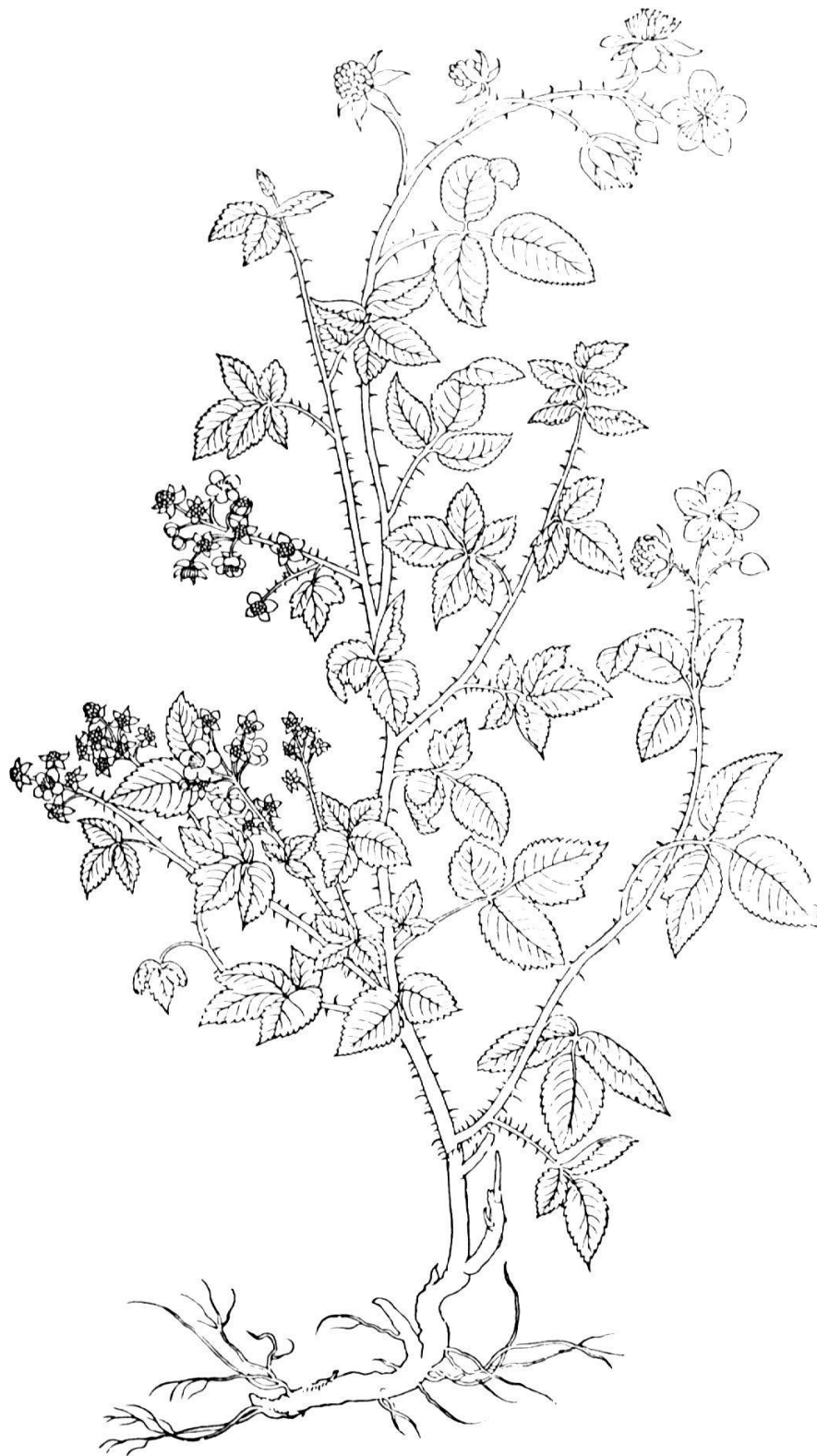
Brombeere, aus dem «New Kreuterbuch» des Leonhard Fuchs, erschienen in Basel, 1543.