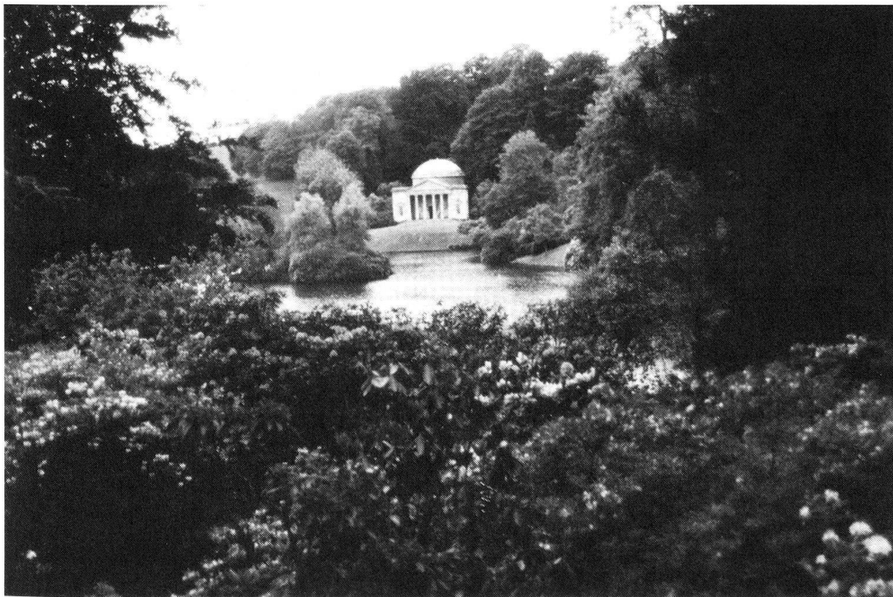
Parc romantique de Stourhead, Wiltshire: Tableau – Surprise sur le Panthéon.

P.s. Toute personne désirant visiter ou avoir des précisions sur ces jardins peut contacter l'auteur: G. Biaggi, Av. Charles-Secrétan 25, 1005 Lausanne.