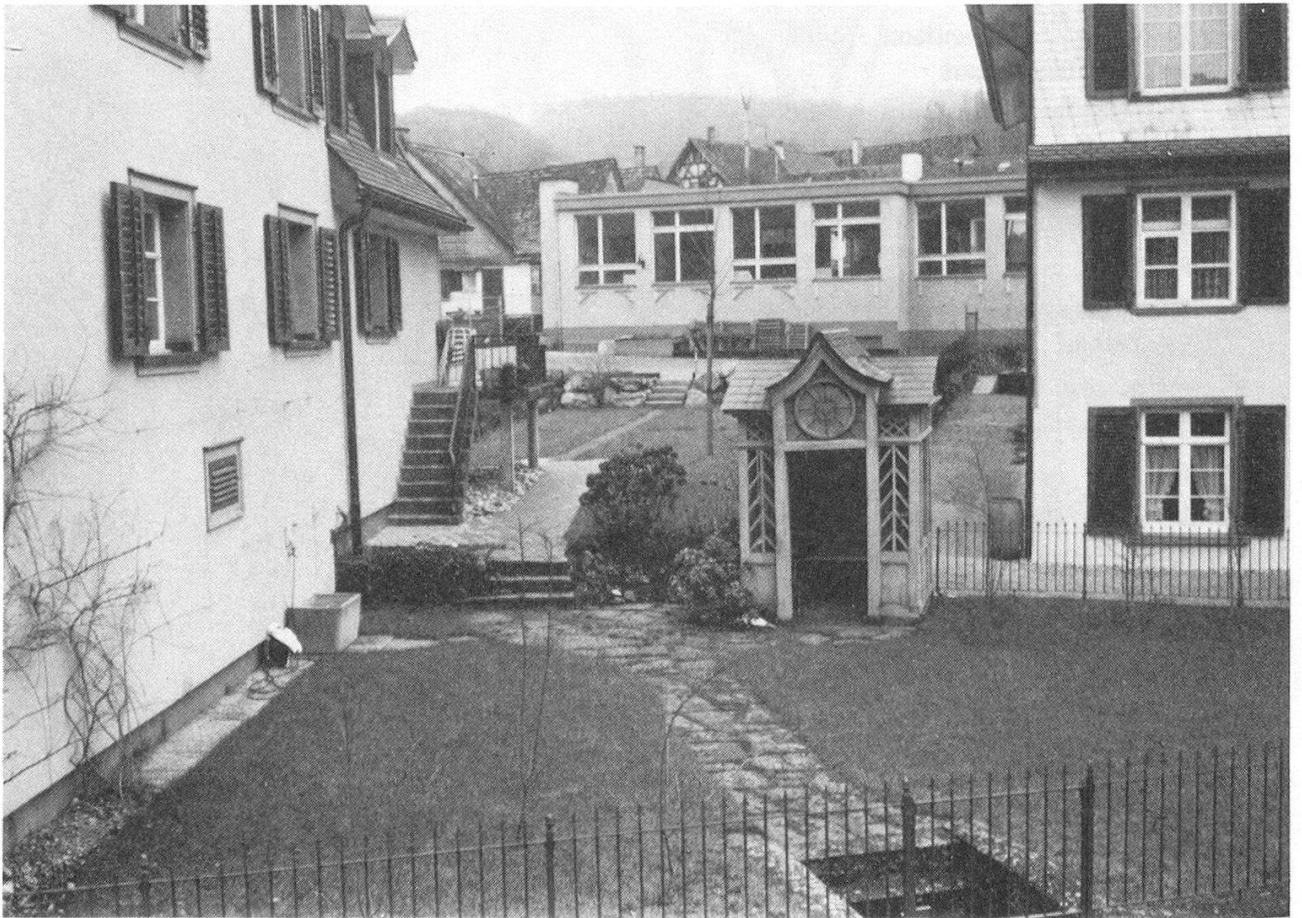
Fotografie U. Vogt Januar 1996 Heutiger Zustand