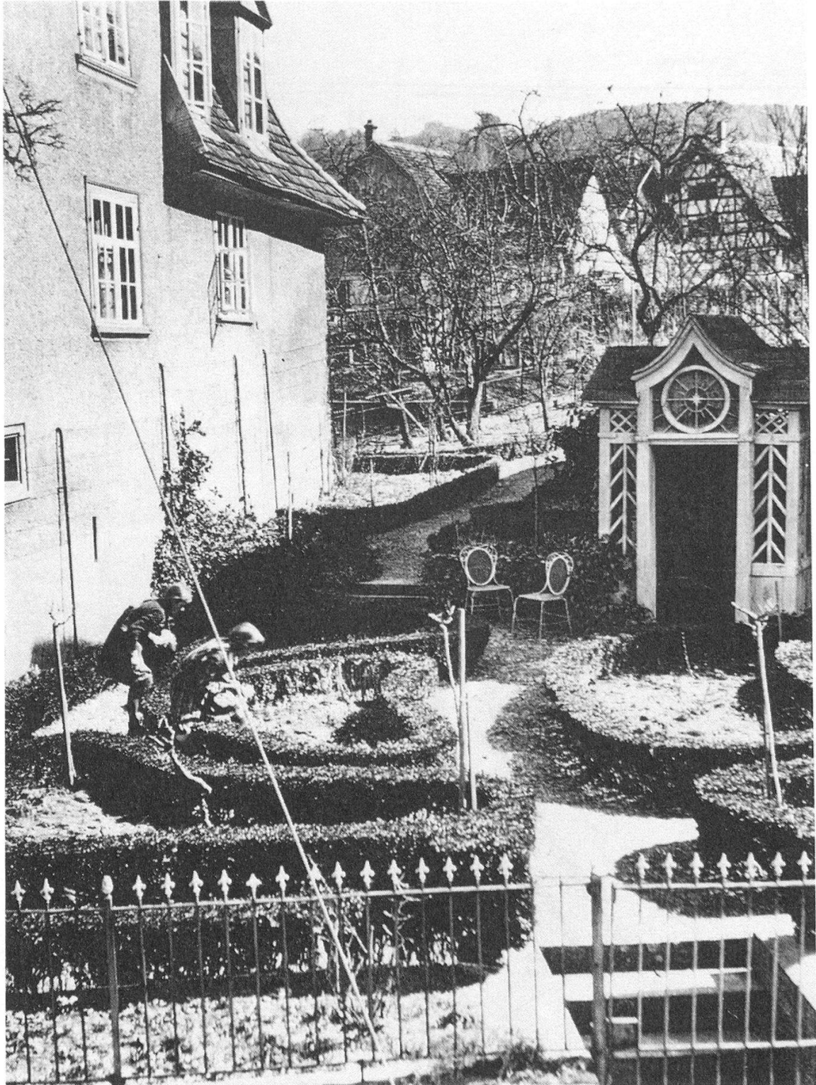
Zustand ca. 1930 Dietrich-Garten beim Grünen Haus, Berlingen