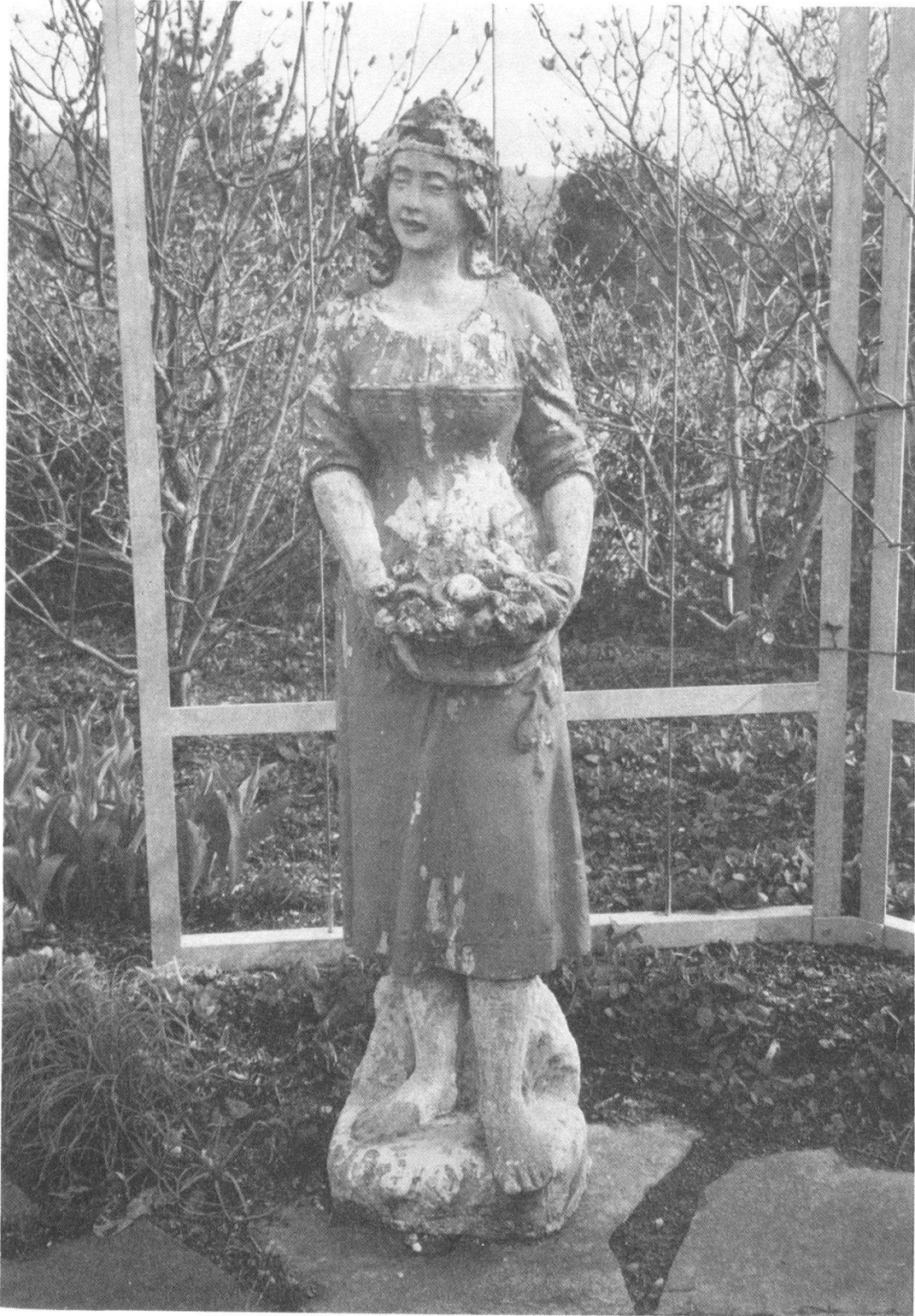
Unbekannte Schöne in einem Garten am Zürichsee