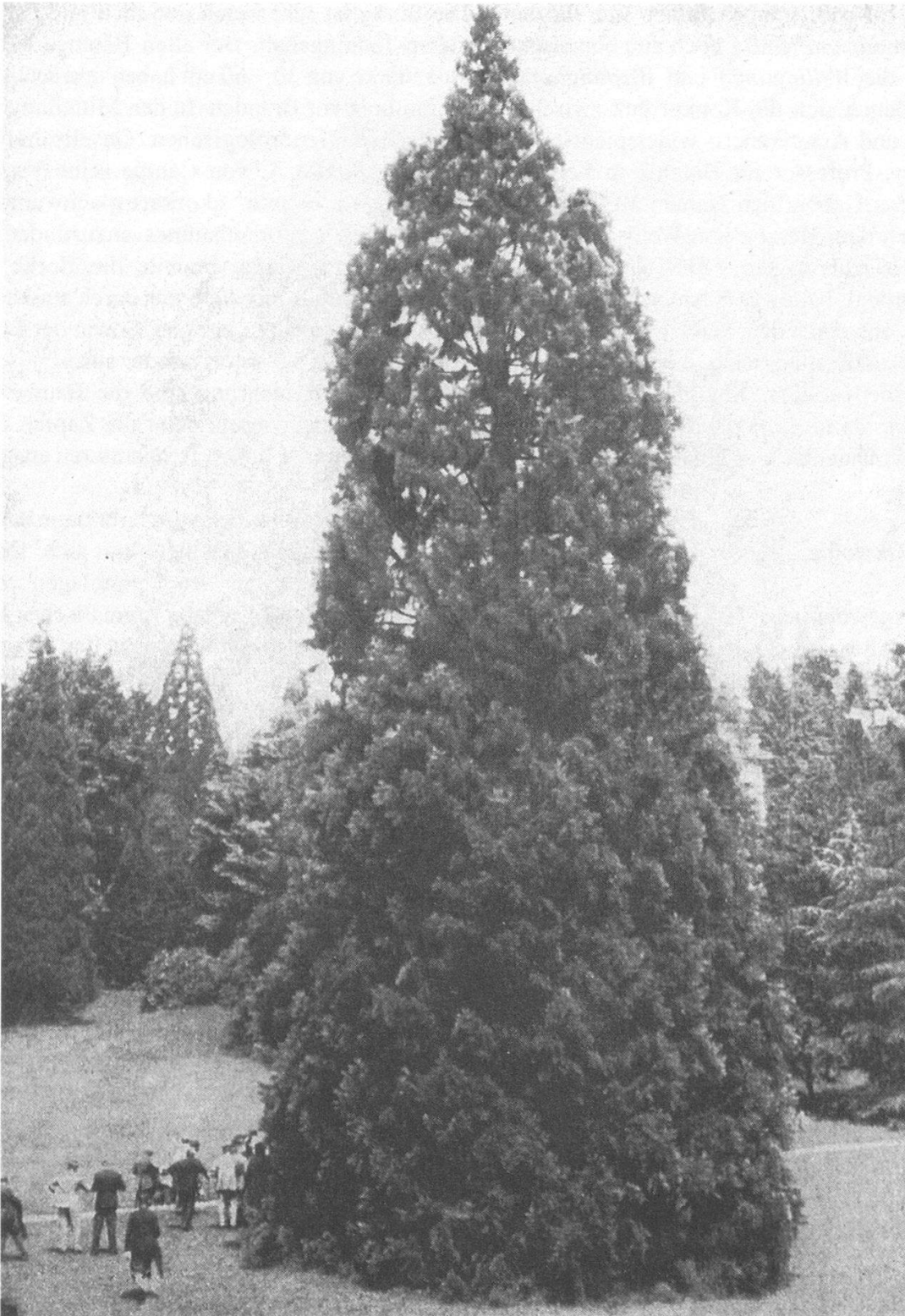
Historische Aufnahme eines Sequoiadendron in Oberhasli LU um 1930. Die Höhe des 1897 gepflanzten Baumes betrug bereits 30 Meter, der Kronendurchmesser 15 Meter. Interessant sind die Menschen am linken Bildrand, die um die Sequoie zu tanzen scheinen.