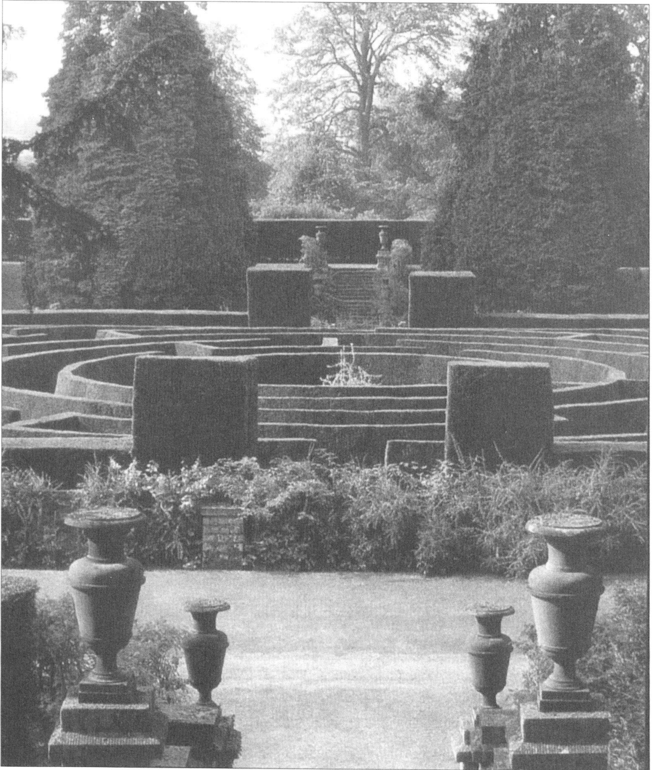
Chatsworth House, Derbyshire, Angleterre: un dédale d'une symétrie parfaite