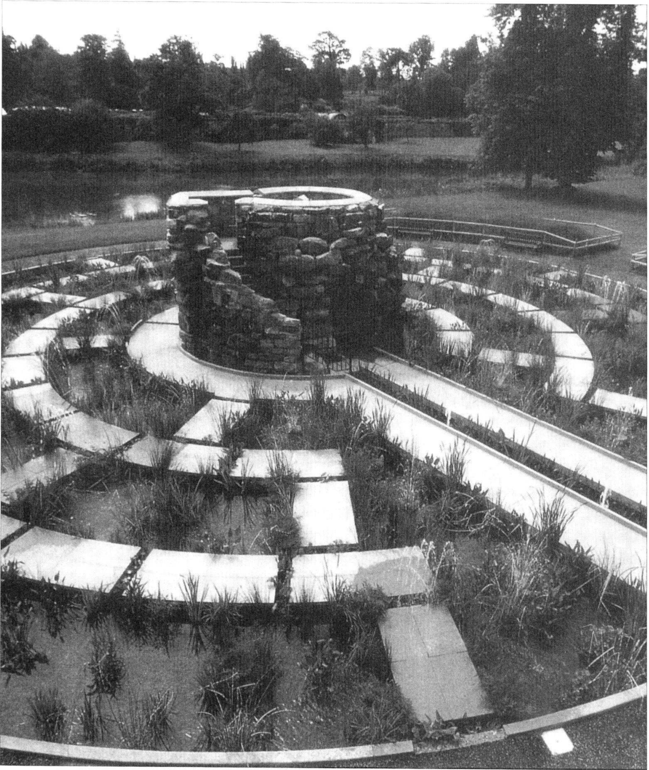
Hever Castle, Kent, Angleterre: attention: les jets d'eau chatouillent!