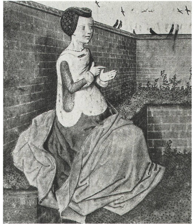
Abb. 5: «Rasenbank an der Mauer, aus Roman de la Rose».

Im Gegensatz zum Akt der Schöpfung steht die Pflege und Unterhaltung von Gärten, die traditionell und auch noch zu Gotheins Zeit als weibliche Kompetenz betrachtet wurde. Das lässt sich beispielsweise in Georg Simmels Essay Weibliche Kultur nachweisen, der das Haus (mitsamt dem Garten) als grösste Kulturleistung der Frau sozio-