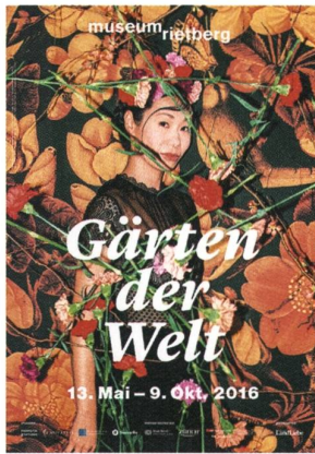
Abb. 2: Plakat der Ausstellung «Gärten der Welt» im Museum Rietberg in Zürich, 2016.

kleinen Beitrag dazu leisten, indem er Gotheins Darstellung von Frauen in der Gartengeschichte in Bezug setzt zu ihrer eigenen Rolle als wissenschaftlich arbeitende Frau, geboren 1863.