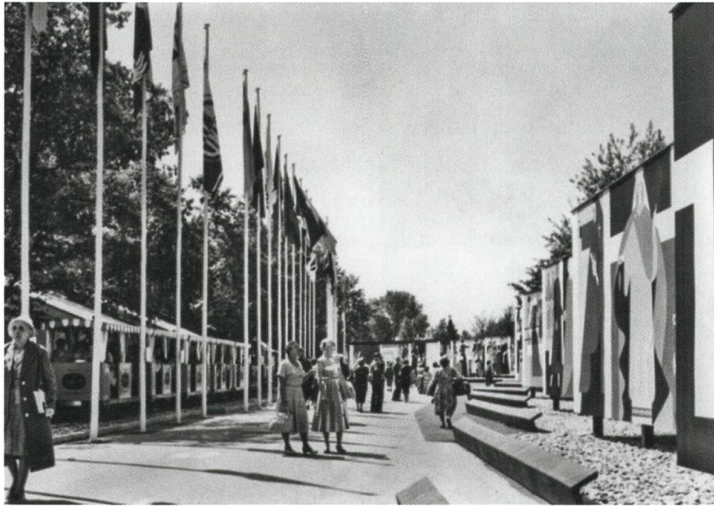
Abb. 6: Postkarte, mit der Linie von Warja Lavater.