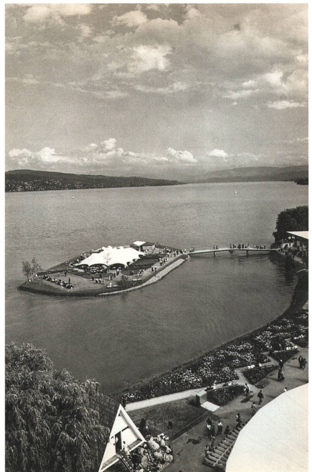
Abb. 1: Saffa-Insel, Foto 1958.

Was ist die SAFFA? Die erste Schweizerische Ausstellung für Frauenarbeit, kurz SAFFA, fand 1928 in Bern statt. 30 Jahre später, 1958, folgte die zweite in Zürich. Organisiert von einer ganzen Reihe schweizerischer Frauenvereinigungen, wollten die Anlässe die Lage erwerbstätiger Frauen thematisieren und deren Wirkungsfelder ausstellen. Obwohl wiederum 30 Jahre später von Folgeveranstaltungen die Rede war, gab es bislang keine weiteren derartigen Manifestationen. Und die bisherigen Veranstaltungen