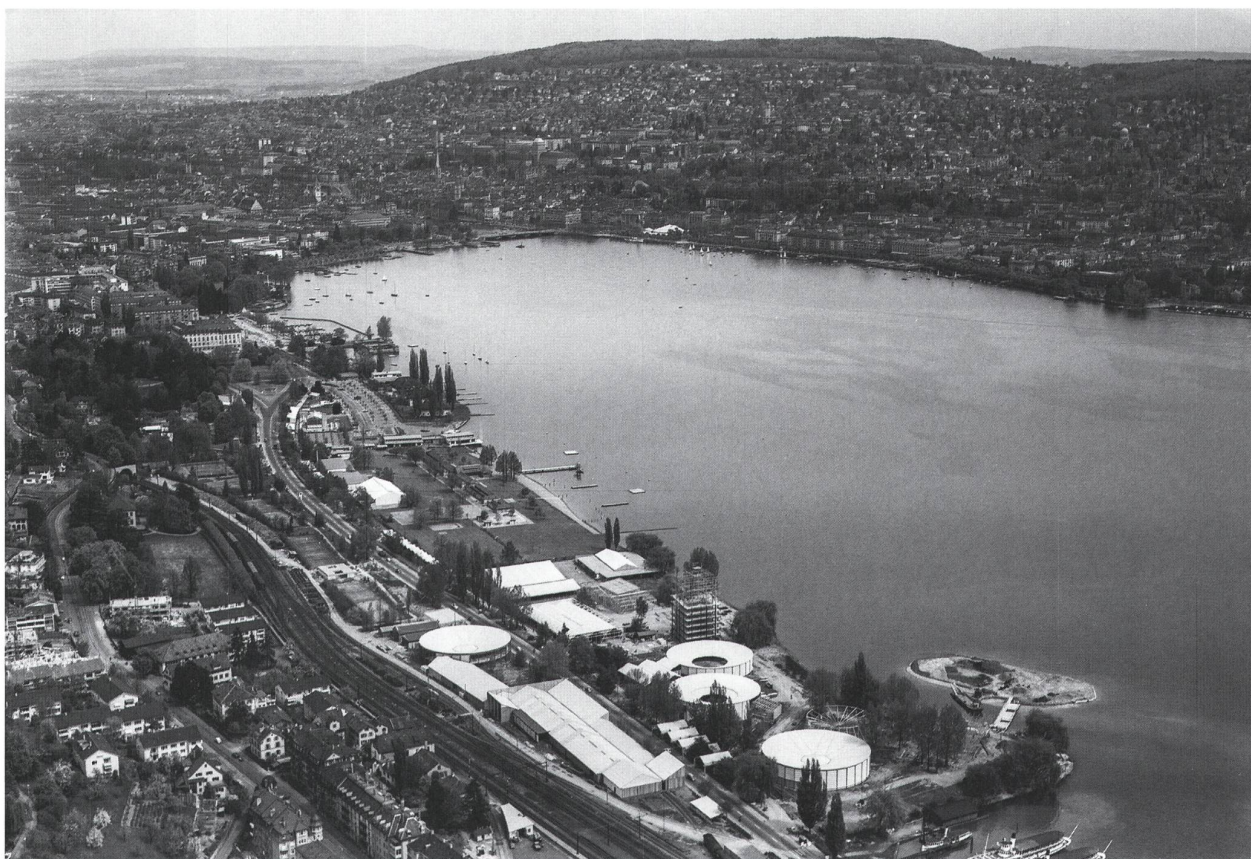
Abb. 4: Luftaufnahme der Saffa im Bau am 8. Mai 1958 in Zürich.

Die zweite SAFFA 1958 in Zürich war erneut bestrebt, in Sachen Frauenrechte nachzuhaken, und deklarierte als Ausstellung von Frauen für Frauen klare Ziele. Sie dauerte vom 17. Juli bis 15. September 1958 und reihte sich ein in einen Reigen von Ausstellungen, die innerhalb weniger Jahre die Signatur einer Epoche prägten: Im selben Jahr fand in Brüssel eine Weltausstellung statt, deren Wahrzeichen – das Atomium – den wissenschaftlichen und technischen Errungenschaften des Atomzeitalters huldigte.