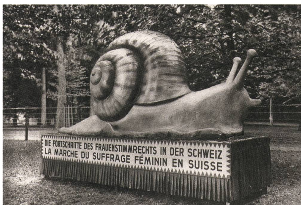
Abb. 3: Die Saffa-Schnecke war ein an Demonstrationen mitgeführtes Symbol der Verschleppung der Einführung des Frauenstimmrechts.

ziertes Wochenendhaus oder die Einzimmerwohnung der ledigen, berufstätigen Frau.