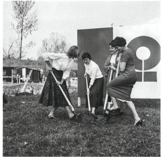
Abb. 7: Spatenstich an der Saffa.

Mythenquai bis zur Landiwiese erstreckte. Die das Gelände durchschneidende Durchgangsstrasse am Mythenquai war für die Dauer der SAFFA gesperrt. Die Ausstellungsmacherinnen liessen die legendäre Gondelbahn der Landi aufleben, schütteten im See eine kleine Insel auf, bauten moderne Pavillons und gestalteten Aussenräume und Gärten. Besonders aufsehenerregend waren die Rundbauten, die als Symbol der Zusammengehörigkeit der Frauen stehen sollten und die verschiedene Ausstellungsthemen beherbergten: «mein Heim– meine Welt», «mit Nadel und Faden» und «im Reich der Küche» bildeten die Hauptthemen.