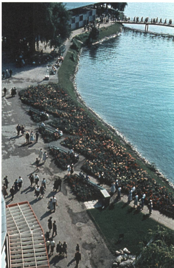
Abb. 8: Sicht vom Wohnturm auf die Gartenanlagen.

langte der Schweizer Verband für Frauenstimmrecht (SVF) vom Bundesrat, den Frauen endlich den Gang an die Urne zur ermöglichen. Dieser verwarf das Ansinnen und hielt in seinem Bericht fest, dass eine eidgenössische Vorlage zur Einführung des Frauenstimmrechts verfrüht sei. Auch hinsichtlich beruflicher Fragen mussten die Frauen Niederlagen einstecken. Die Forderungen nach gleichem Lohn für gleichwertige Arbeit vonseiten des Bundes Schweizerischer Frauenorganisationen (BSF) und weiblicher Berufsverbände blieb erfolglos. Den Frauenbewegungen gelang es nicht, sich durchzusetzen, und so verhielten sie sich im Vorfeld der Volksabstimmung zur Einführung des Frauenstimmrechts 1959 eher abwartend und zurückhaltend – auch an der SAFFA.