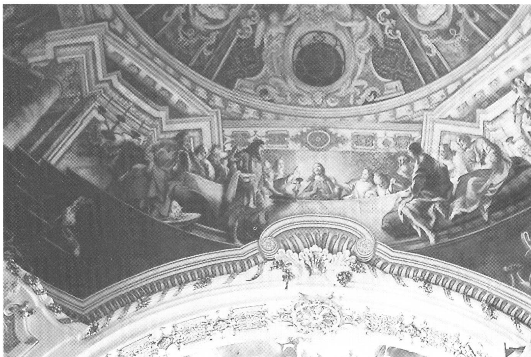
Kloster Einsiedeln, Kuppel des Predigtraumes: Das Abendmahl.