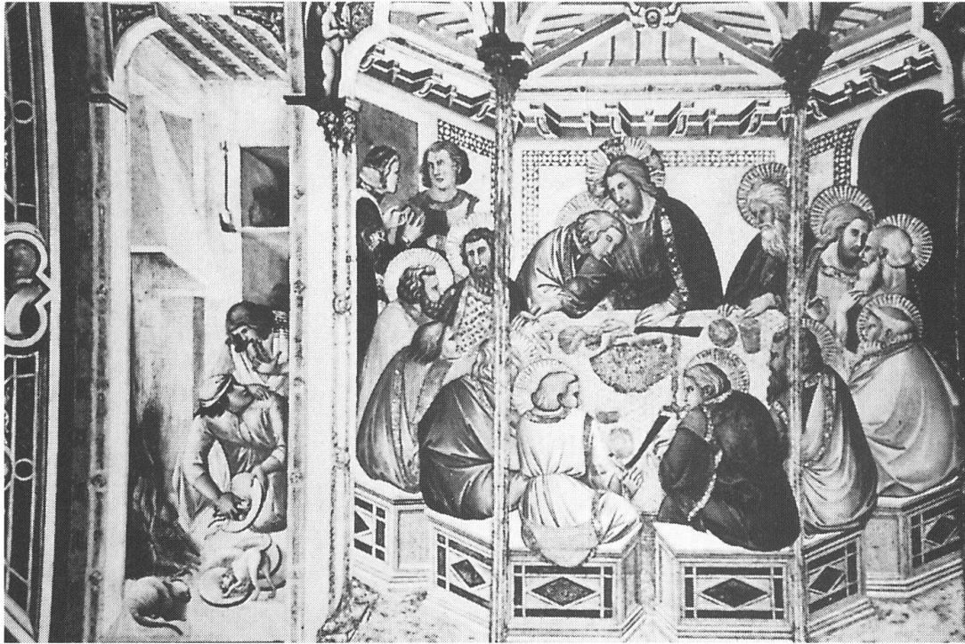
Assisi, San Francesco: Abendmahl von Lorenzetti im Südquerschiff der Unterkirche.