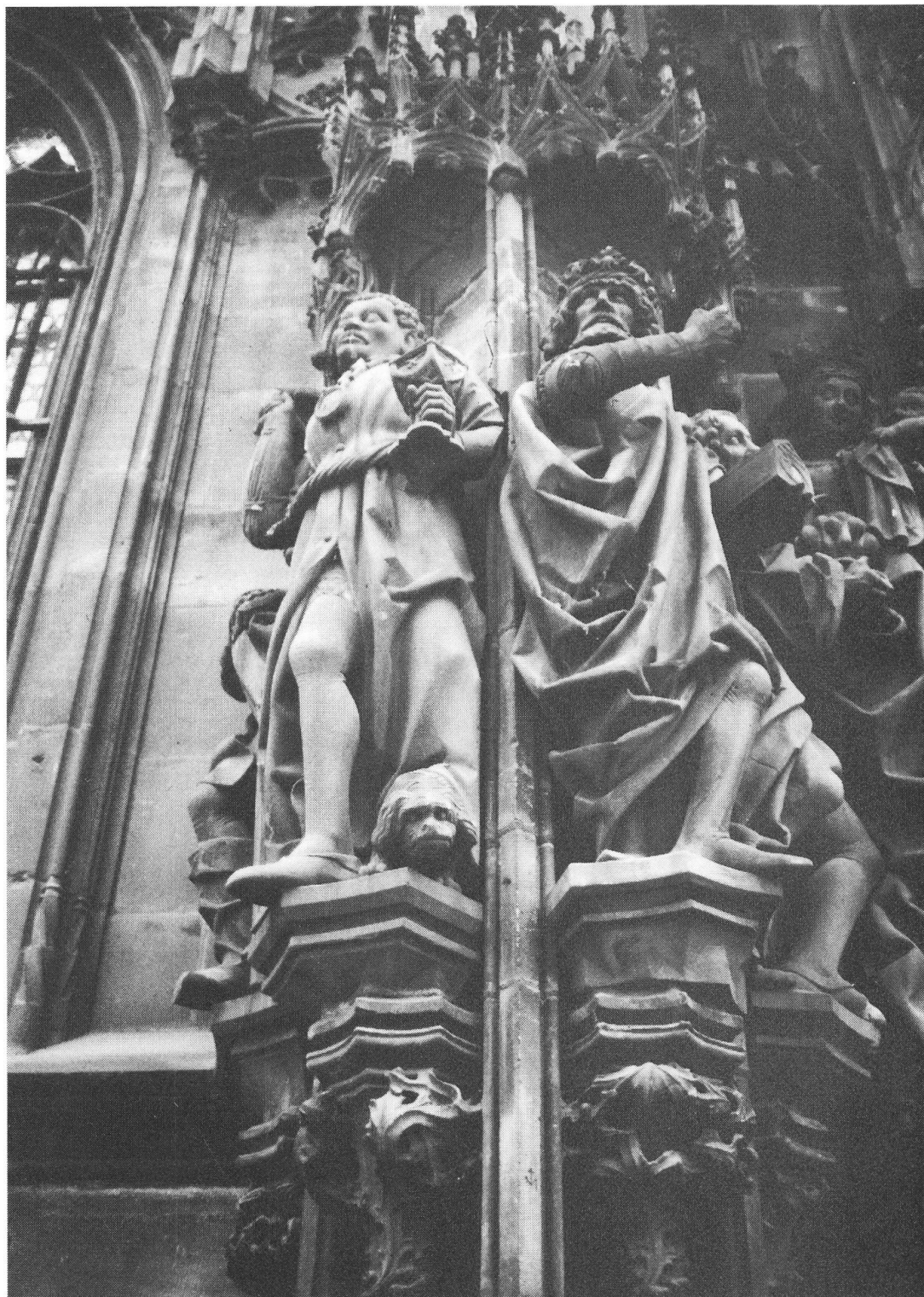
Strassburg, Nordportal der Kathedrale: Die drei Könige.