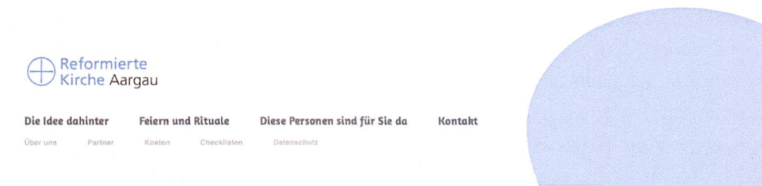
Abb. 5. Startseite der Ritualplattform Leben-feiern .

sich inhaltlich. Thut adressiert die Lesenden und bewirbt ihre Dienstleistung, Pfeiffer nennt seine Vorlieben und Hobbies und Blumer nennt die Potentiale «gottesdienstlicher Rituale». Während Ritualbegleitende auf dem freien Markt darum bemüht sind, ihre Qualifikation und Funktion deutlich zu kommunizieren, indem sie sich als «zertifizierte Zeremonienleiterin», «Freie Rednerin» oder «Freie Theologin» anpreisen 11 , bleibt hier die Qualifikation der drei Personen unbestimmt. Ihre Versiertheit und ihr Charisma müssen wir ihnen glauben. Die uneinheitliche Textgattung wirkt zudem etwas disparat. Dass es sich hier um drei Pfarrpersonen handelt, wird nicht gesagt.