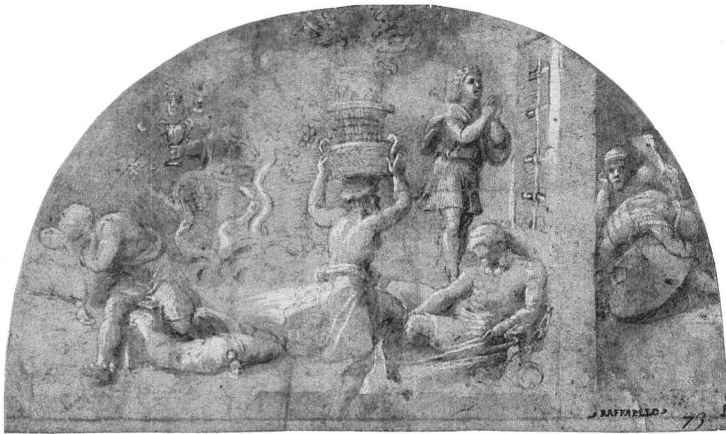
Abb. 3. Raffael (und sein Schüler Gianfrancesco Penni?), Der betende Joseph im Gefängnis; um 1513–1519.

umgesetzt wurde. 49 Möglicherweise gehört sie zu den nicht realisierten Entwürfen, wie etwa Raffaels Entwurf zur Apokalypse. 50 Die innovative Szene mit Joseph im Gebet geht über die Beschreibung in der Bibel hinaus. Sie illustriert das Papstmotto von Leo X. [Ps 120,1]: «Ich rief zum Herrn in meiner Bedrängnis, und er hat mich erhört». 51 Dem Erhören durch Gott folgt die Befreiung aus dem Gefängnis. Insofern ist das ikonographisch singuläre Blatt in dreifacher Hinsicht bedeutungsvoll: durch die Wiedergabe der für den Papst wichtigen Symbolfigur Joseph, durch die Parallele ihrer Gefangenschaft sowie durch das inständige Beten, wie es im Papstmotto verankert ist.