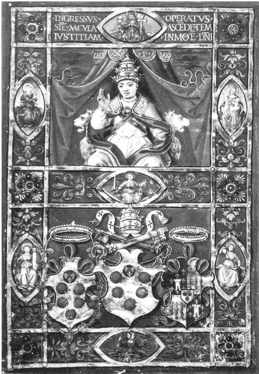
Abb. 1. Piero Cattaci, Genealogia medica 1518; Florenz, Biblioteca Medicea Laurenziana Med. Pal. 225, fol. 5 v.