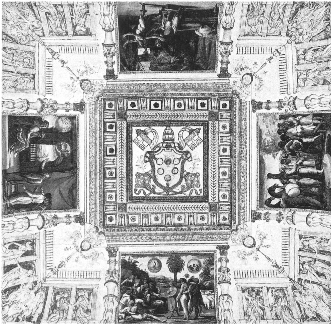
Abb. 4. Raffael und Werkstatt, Josephsgeschichte; Vatikan, Apostolischer Palast, Loggien, 7. Joch.

Zukunft der Ägypter sieben magere und sieben fette Jahre. Die kluge Führung eines Herrschers, der vorausschauend handelt, wird hier stellvertretend für den amtierenden Papst veranschaulicht.