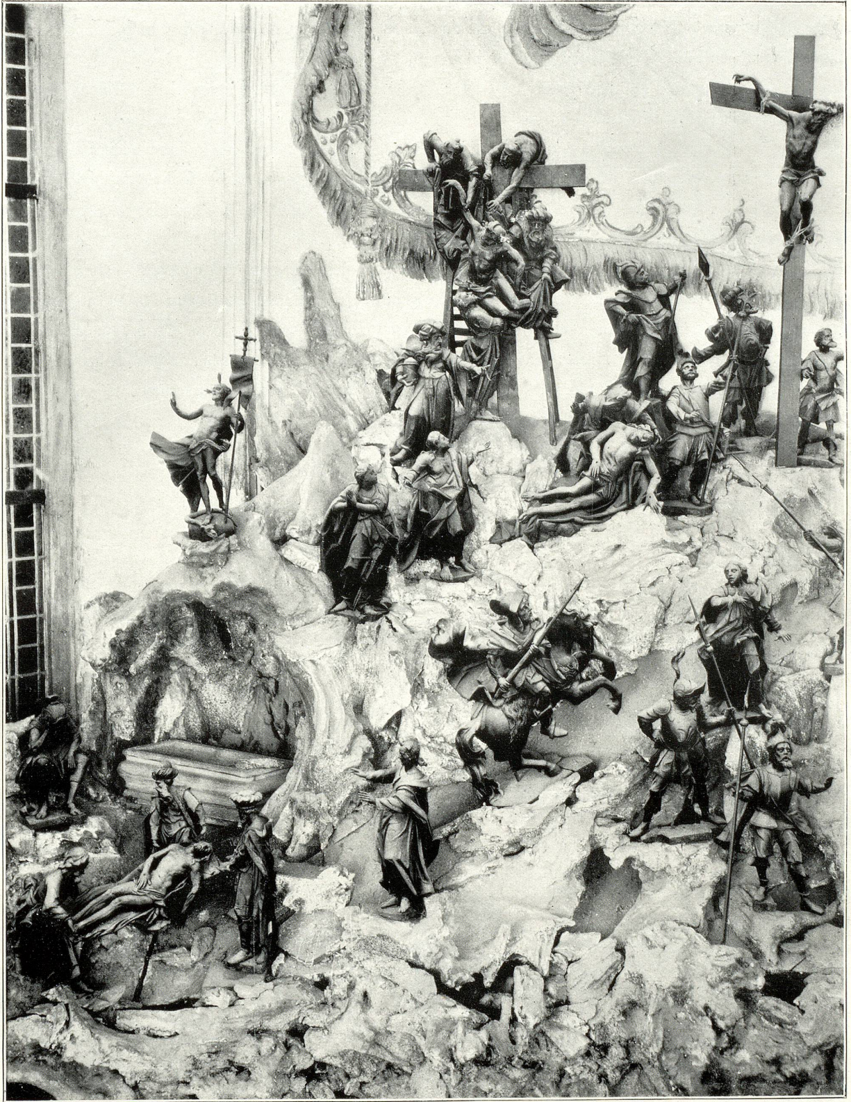
Teilansicht des obersten Teiles vom Oelberg.