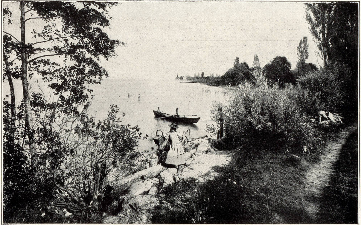
Kreuzlingen. — Idyll am See.