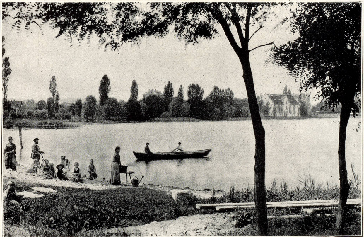
Am Strande in Kreuzlingen.