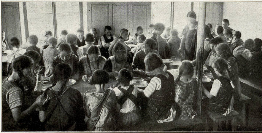
Im Esszimmer, das erweitert werden sollte

Wechsel der Umgebung ist da in erster Linie nötig. Er genügt aber nicht, die Schädigung hat das ganze Affektleben, die Gefühle, das Willensgebiet, die Leidenschaften, das ganze Triebleben erfasst. Das Kind sieht in seinem Tun und Lassen nichts Ungebührliches, weil kein Gewissen innere Hemmungen schafft, keine Selbstkritik einsetzt. Es kann sich nicht handhaben; dem Gedanken folgt reflexartig die Ausführung. «Schlingel» nennt sie der blinde Riese Publikum, während es doch Seelenkranke sind. Nichtkönnen hält er für Nichtwollen. Wie soll das psychopath. Kind etwas kön-