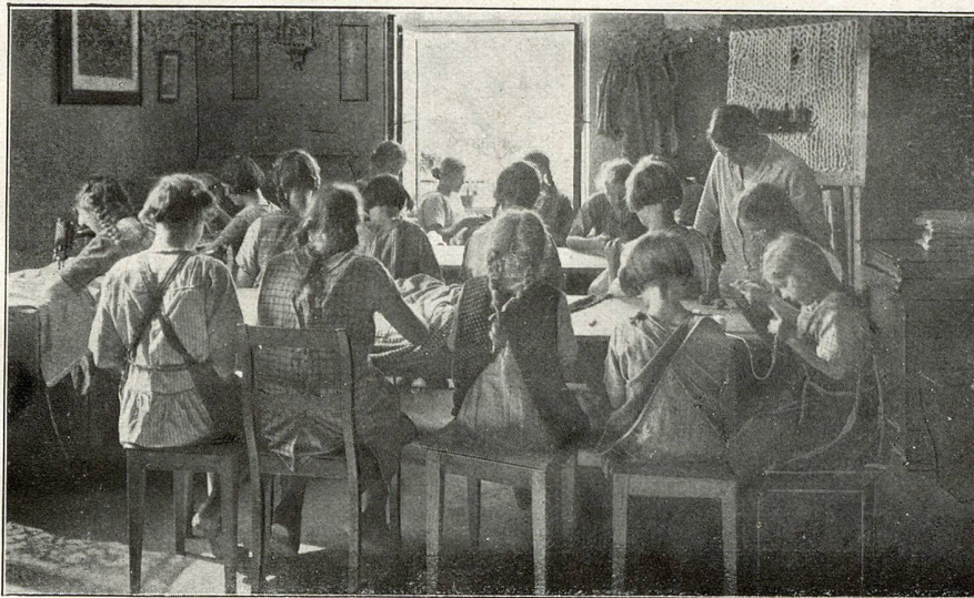
Im Arbeitszimmer der Mädchen, das viel zu klein ist

Unsere Anstaltsschule kann sich mit Normal-schulen nicht mehr messen. Es fehlt die Gedächtnisbildung der Neueintretenden, mangelt an gesundem Ehrgeiz, gebricht am psychischen Vermögen. Wohl leistet die glückliche Gruppe der bloß im Verhalten Geschädigten in der Schule so viel wie Normalschüler; aber ihre Zahl ist eben zu