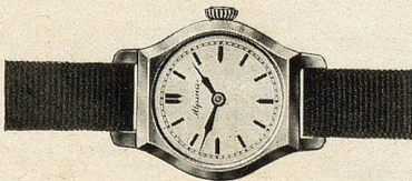
Gold 14 Kt. . . . . Fr. 137.—