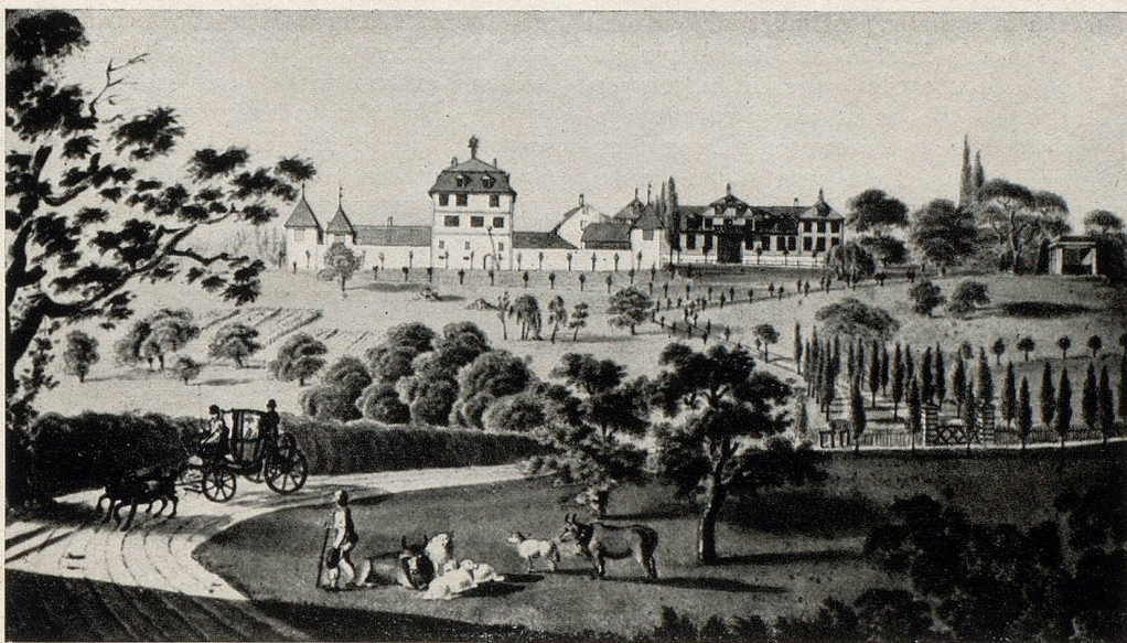
Schloss Wolfsberg (ca. 1830) nach einem zeitgenössischen Aquarell im Schloss Wolfsberg.

Charleville zur Welt, wo ihr Vater ein angesehenes Mitglied des Rates der Stadt war und es später während der Revolution zum Deputierten der konstituierenden Versammlung brachte. Nach der Schreckensherrschaft kam sie in das von Madame Campan, der geistvollen Vorleserin der Königin Marie Antoinette, eröffnete Institut. Dort traf sie neben vielen Schülerinnen, die später in der Gesellschaft des Konsulates und des ersten Kaiserreiches eine bedeutende Rolle spielten, auch die Tochter der verwitweten Josephine Beauharnais, Hortense, die im gleichen Alter stand wie sie. Die auf diese Art entstandene Bekanntschaft artete bald in intime Freundschaft aus, und als Hortense durch die Wiederverehelichung ihrer