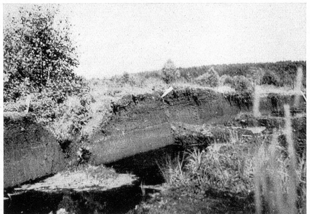
Die dunkeln Wasserlachen