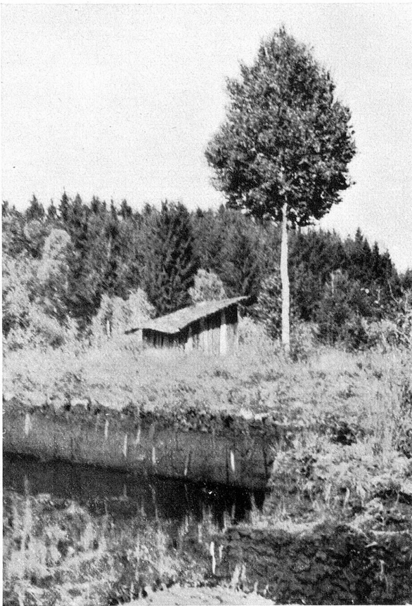
Ein verträumter Winkel

Über die Entstehung des Moores bestehen zwei verschiedene Auffassungen. Neuweiler 1 kam auf Grund von Torfuntersuchungen zur Ansicht, daß nach dem Rückzug des Rheingletschers sich ein Wald auf der Grundmoräne ansiedelte. «Ein Moor hatte die Fähigkeit, in denselben einzudringen und seine Versumpfung herbeizuführen.» Fräulein Josephy 2 hingegen glaubt, daß nach der Gletscherzeit ein See liegen blieb, der allmählich verlandete. Auf der Verlandungsdecke baute sich im weitern Verlaufe das Moor auf. Beide Arten der Moorbildung sind erwiesen; für das Hudelmoos hat wohl die erste Auffassung auf Grund von Tatsachen, die nicht weiter erörtert werden können, größere Berechtigung.