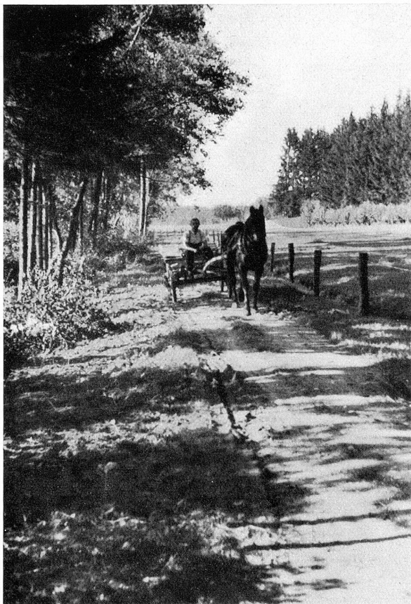
Einfahrt ins Moor von Norden

Wenn schon die Tierwelt nicht so enge an bestimmte Lebensverhältnisse gebunden ist wie die Pflanzen, so zeigen doch besondere Gebiete auch ihre eigene Fauna. Noch sind leider die Tiere des Hudelmooses nicht in dem Maße bekannt wie die Pflanzenwelt. Aber auch dem auf diesen Gebieten weniger Bewanderten tönen oft fremde Stimmen ans Ohr. An schönen Frühlingsmorgen hört man den melodiosen Gesang des Rohrsängers. Der Stieglitz freut sich seines Daseins. Die Wacholderdrossel ist vor einigen Jahren eingezogen. Schade, daß die Bekassine, die Himmelsziege oder Moosgeiß, an