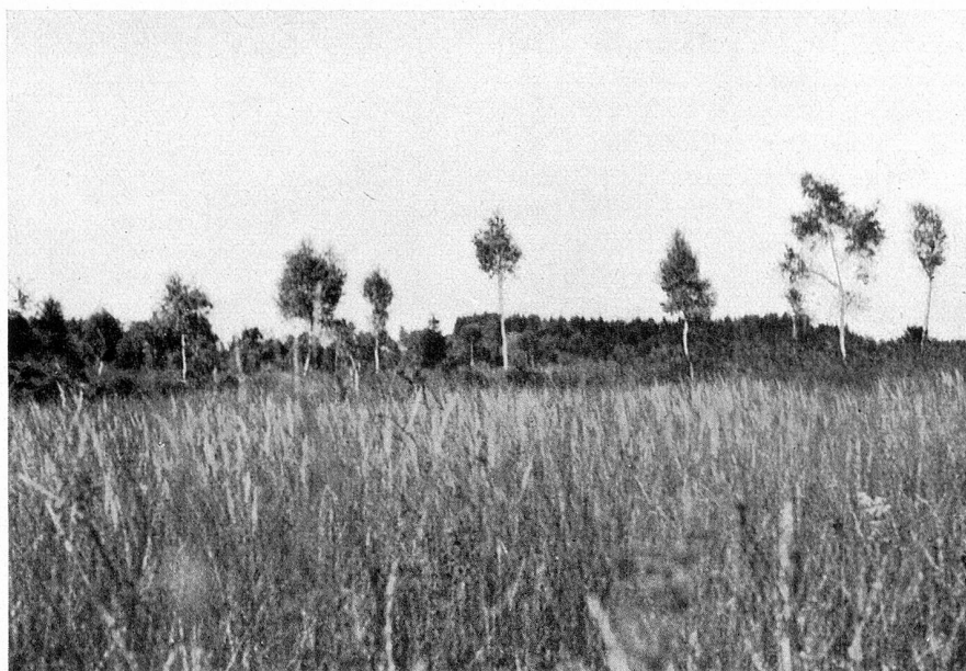
Im Vordergrunde Flachmoor, im Hintergrunde Hochmoor

Wird das Flachmoor sich selbst überlassen, das heißt werden die Riedgräser nicht als Streue geschnitten, so häufen sich die verkohlenden Pflanzenteile. Der Einfluß des kalkhaltigen Grundwassers nimmt mehr und mehr ab. Die Neutralisation der gebildeten Säuren wird zurückgedrängt; der Boden