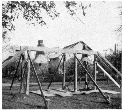
Die beiden kleinen alten Glocken auf ihrem Holzgerüst

Voll Sehnsucht erwartete das ganze Dorf den 8. Dezember 1934, den Tag des Glockeneinzuges. Als ich um halb 11 Uhr jenes denkwürdigen Tages auf den Bahnhof kam, umringten schon viele Leute den Eisenbahnwagen, auf dem unsere vier neuen Glocken standen. Ich war ganz erstaunt über die Größe und Schönheit des Geläutes, welches das Weihnachtsgeschenk des ganzen Dorfes werden sollte. Auch die Sonne, die endlich den dicken Nebel durchdringen konnte, wollte sehen, wie die schweren