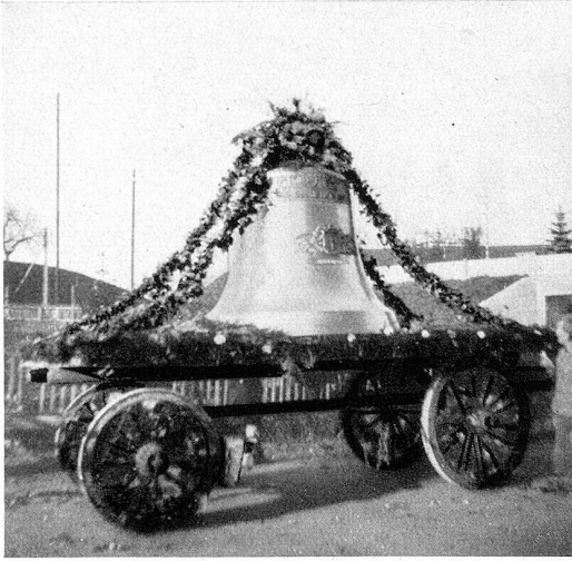
Die größte Glocke „h“

dierte: «Vorwärts marsch!» und mit den ersten Tönen eines Marsches zogen die Pferde kräftig an. Jung und alt begleiteten die Glocken mit frohen Gesichtern durch die zur Kirchgemeinde gehörenden Ortschaften Tobel, Zezikon und Affeltrangen. Unterdessen verdichtete sich der Nebel wieder; der ganze Umzug wurde von ihm eingehüllt und um 4 Uhr hatten unsere neuen Glocken die ehrwürdige Einzugsfahrt vollendet. Bei nassem und kaltem Nebel begrüßte Herr Kantonsrat Rieser das Geläute und hieß es im Namen des ganzen Dorfes herzlich willkommen.