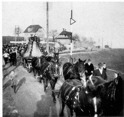
Der Einzug der Glocken

Einen besonders feinen Anblick bietet der Chor, der völlig umgebaut werden mußte. Die Kirche diente früher beiden Konfessionen und im Chor stand der Altar der Katholiken, der nun herausgenommen worden ist. So galt es den freigewordenen Raum neu zu gestalten und dem Innern einzugliedern. Sein Farbton ist nun dunkler gehalten als derjenige des Schiffes. Die kräftigbraune Täfelung reicht hier bis zu den Fenstern. Einfache Stühle umgeben den eckigen Raum. In der Mitte steht der Taufstein. Links und rechts von ihm befindet sich eine zweite Reihe Chorstühle, deren Abschluß das Harmonium bildet.