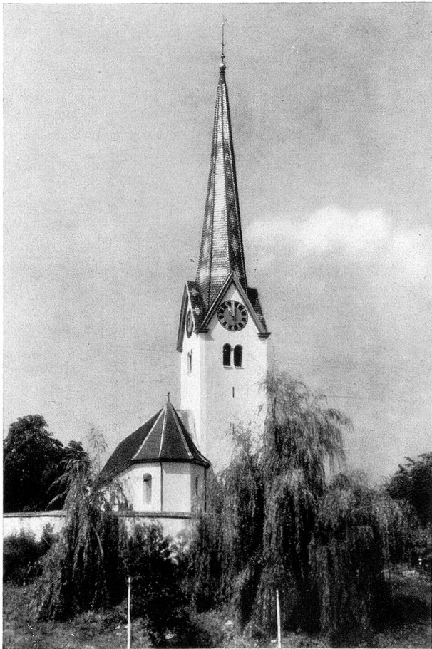
Die Kirche in Affeltrangen nach der Renovation

Nach dem Mittagessen, das ich hastig einnahm, begab ich mich wieder auf den Bahnhof. Von allen Seiten strömten die Leute herbei, um die neuen Rufer und Mahner zu sehen und zu betasten und ihnen einen würdigen Empfang zu bereiten. Auch die Musikanten rückten in ihren grünen Uniformen und mit den Instrumenten auf. Endlich schritten einige Fuhrmänner mit achtzehn stattlichen Pferden daher. Die Geschirre waren sauber geputzt und die Sonne spiegelte sich im Messingzeug. Vor dem Wagen mit der größten Glocke wurden sechs Pferde gespannt und vor die andern je vier. Die Musik stand in Reih' und Glied bereit, der Dirigent komman-