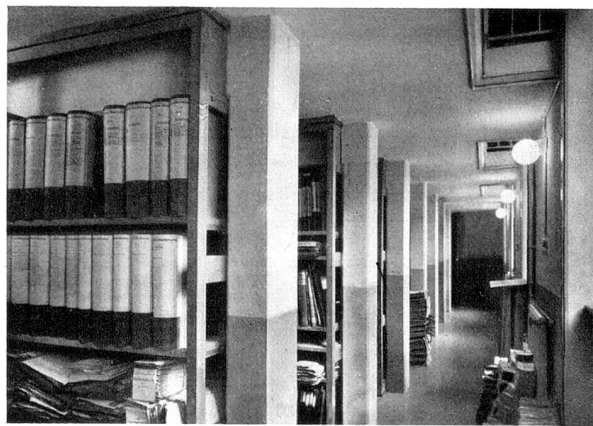
Ein Raum des neuen Staatsarchives

daß die Bedürfnisse und Interessen der kantonalen Behörden und Verwaltungen den Vorrang erhielten. Man hat darum im Thurgau ein Verwaltungsarchiv, nicht ein eigenes wissenschaftliches Institut schaffen wollen, und man hat den Zusammenhang mit der Verwaltung durch die Angliederung des Archives an die Staatskanzlei sichergestellt. Auch in der Benützungsbildung zeigt sich der Vorrang der Ämter vor den Privaten. Dies bedeutet nicht Engherzigkeit und Einschränkung der wissenschaftlichen Arbeit. Der Regierungsrat hat im Gegenteil den Grundsatz in sein Archivreglement aufgenommen, daß das Staatsarchiv jedermann offen steht unter den Einschränkungen, die öffentliche Ordnung und allgemeines Staatswohl verlangen. Auch die Auslese, die vor allem das riesige Ausmaß der neuen Bestände hinsichtlich Aufbewahrungswürdigkeit verlangt, wird unter Berücksichtigung der Bedürfnisse der Verwaltung und gleichzeitiger Rücksichtnahme auf künftige Geschichtsforschungen vorgenommen. Das Ziel der Archivneuordnung, das im Frühjahr 1940 erreicht sein soll, liegt in der Schaffung einer