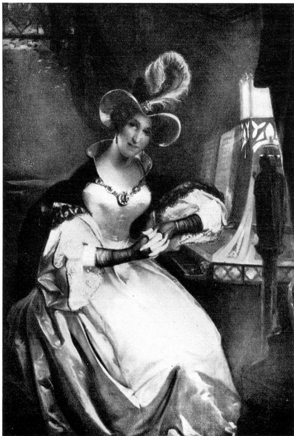
Königin Hortense Nach dem Gemälde von F. Cottrau, 1834