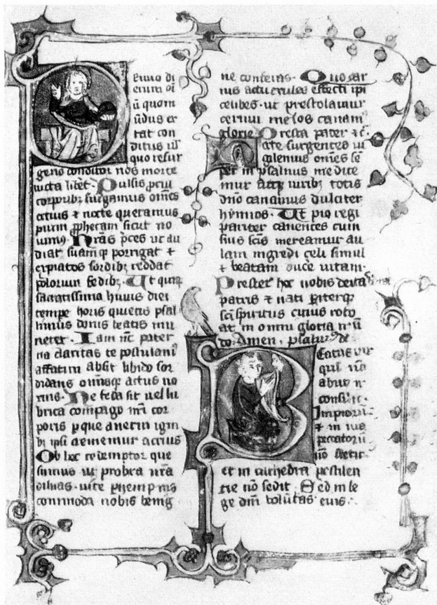
Abb. 1. Beginn des Psalteriums; Seite 17 des Breviers, im Original 11 auf 17 cm

1. Das Calendarium gibt einen Jahreskalender mit Tagen und Monaten, Leitsprüchen für jeden Monat, den astronomischen Zeichen und den wichtigsten hohen Kirchenfesten. Aber noch sind nicht auf alle Tage Heilige angesetzt, noch sind es immer die gleichen Heiligen, die aufgeführt werden. Jeder Verfasser hat je nach der Gegend, aus der er stammt, seine ausgesprochene Vorliebe. Aus diesen unterschiedlichen Heiligenlisten kann man wertvolle Schlüsse ziehen über die Herkunft eines Breviers.