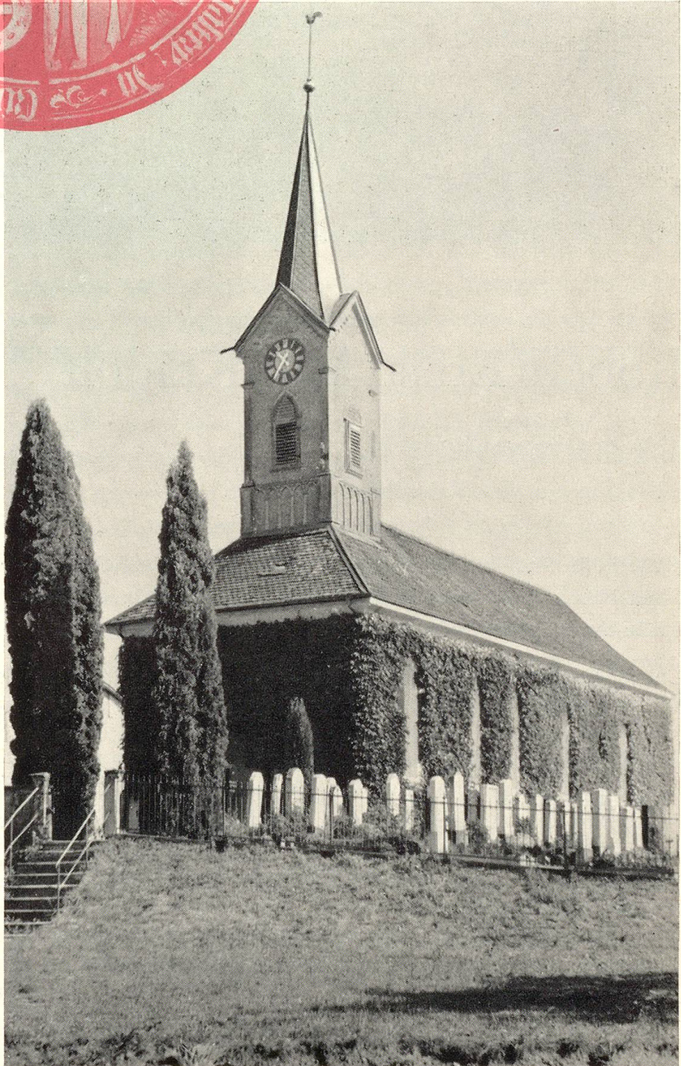
Das Aawanger Kirchlein vor dem Umbau