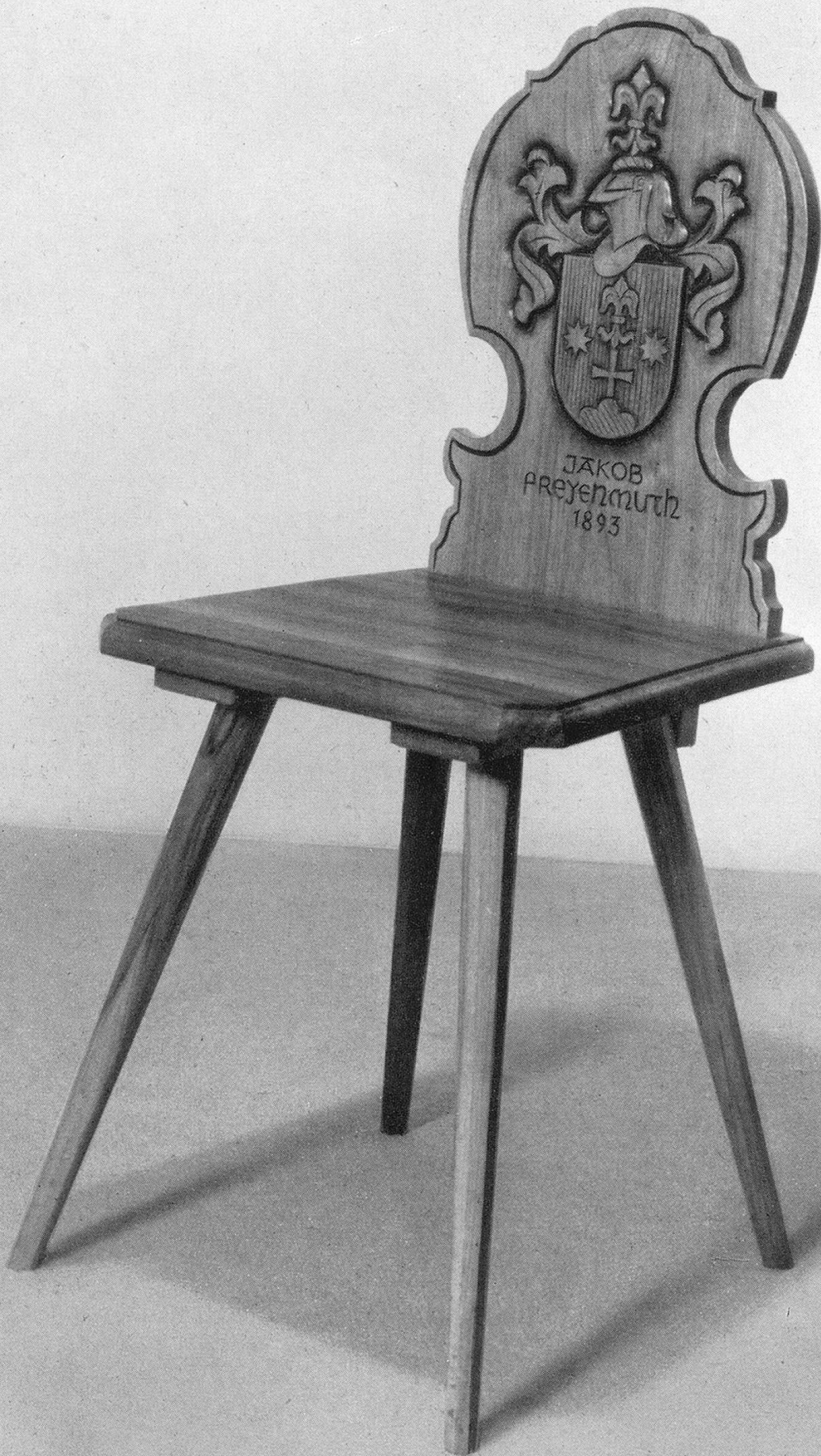
Eine Arbeit aus der Werkstätte für Möbel und Innenausbau Jak. Freyenmuth, Frauenfeld