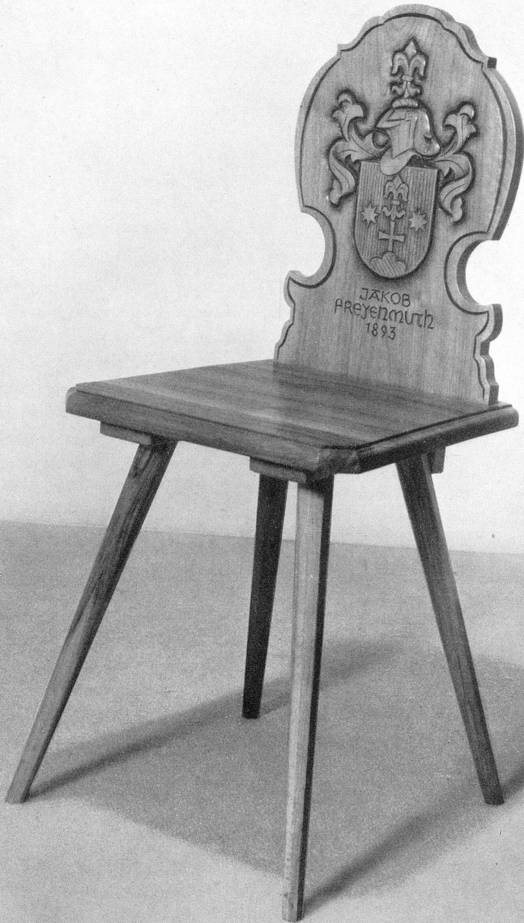
Eine Arbeit aus der Werkstätte für Möbel und Innenausbau Jak. Freyenmuth, Frauenfeld