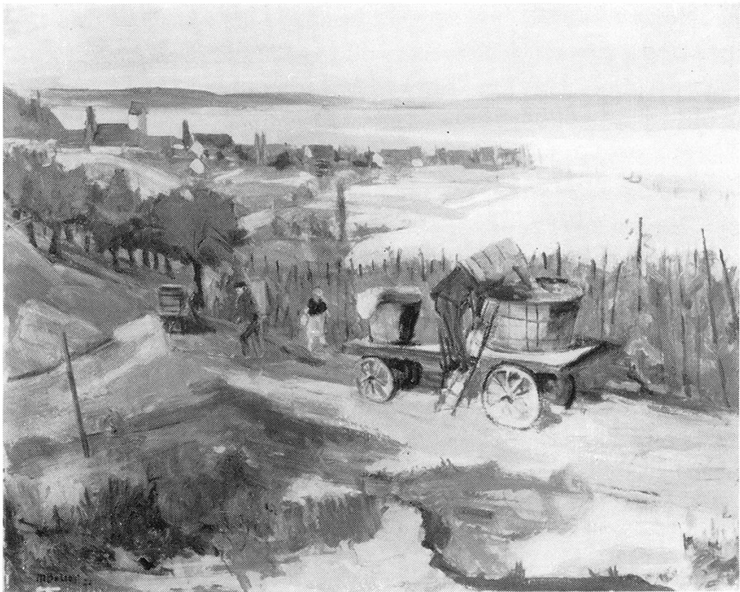
«Wimmet» in Ermatingen