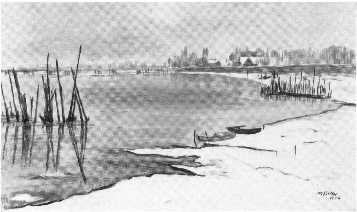
Winter bei Gottlieben