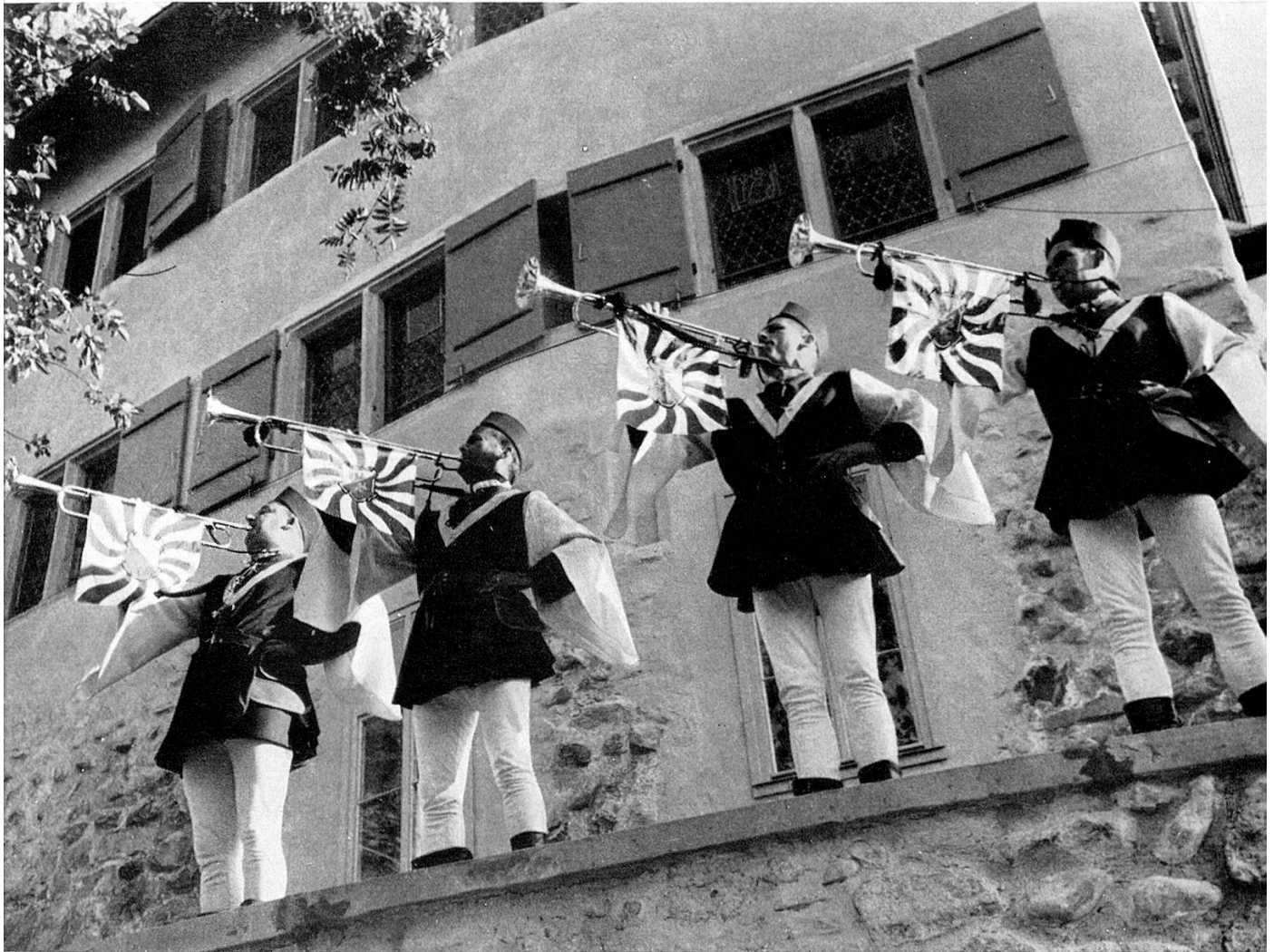
Mit Fanfaren wird das Fest eröffnet