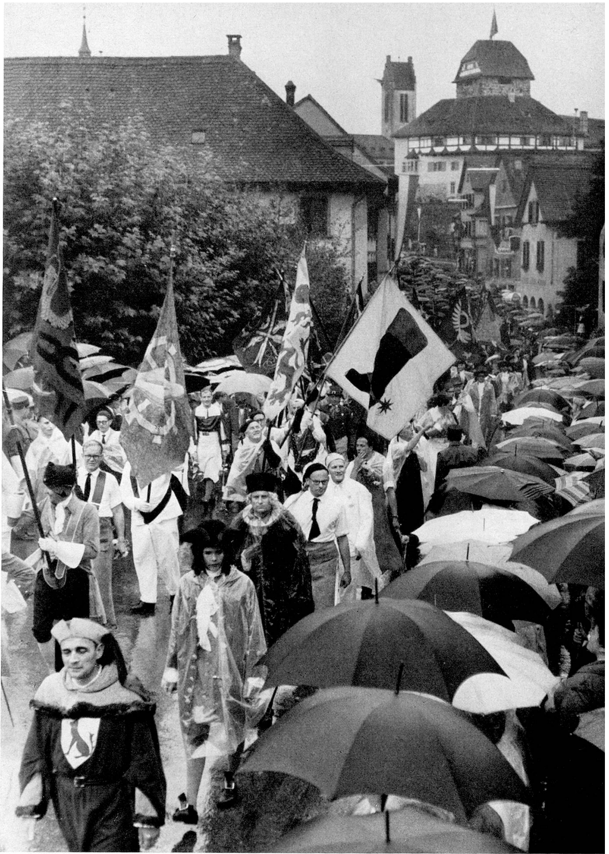
Die Zürcher Zünfte