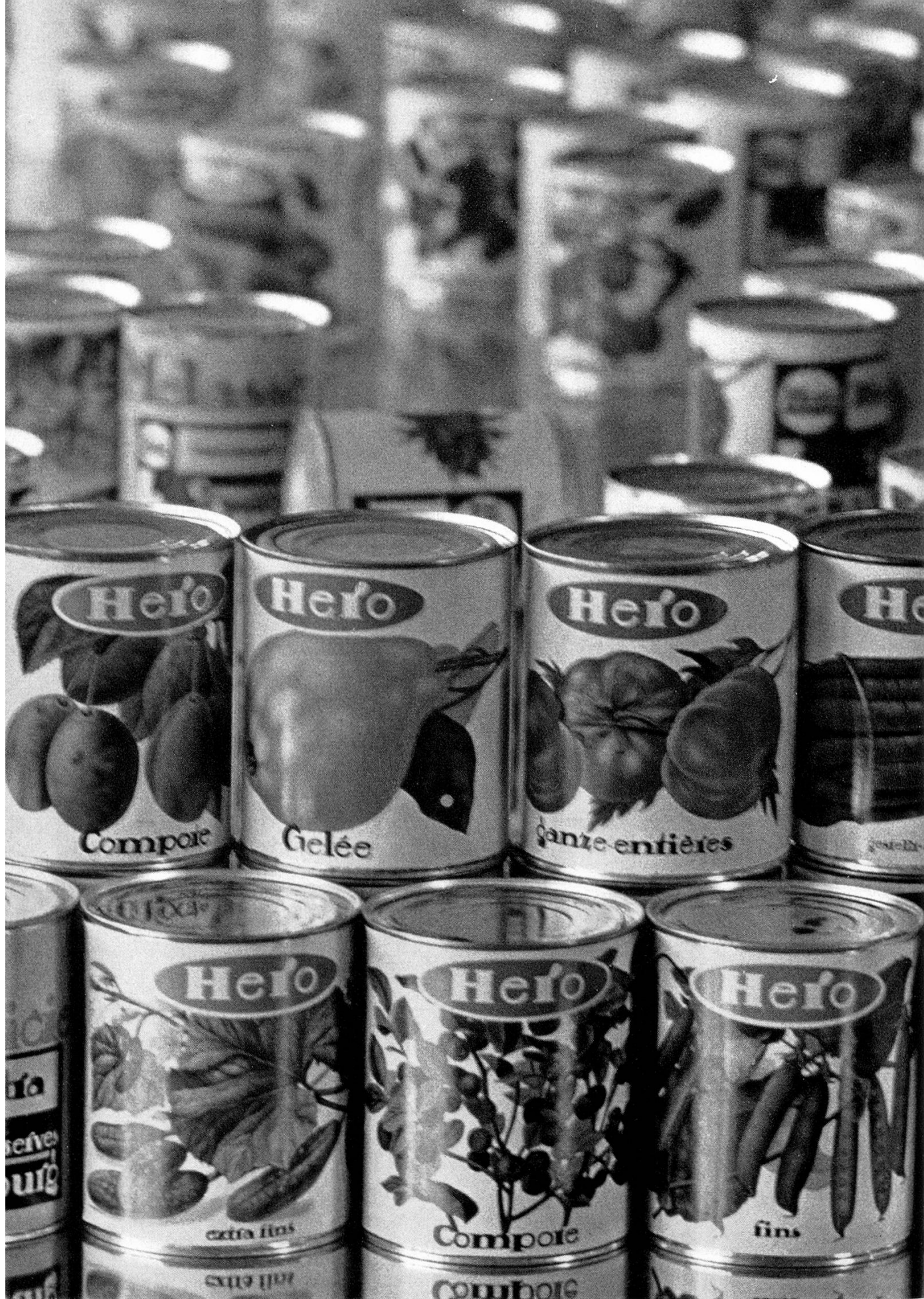
Einige Produkte der Hero Conserven Lenzburg und Frauenfeld