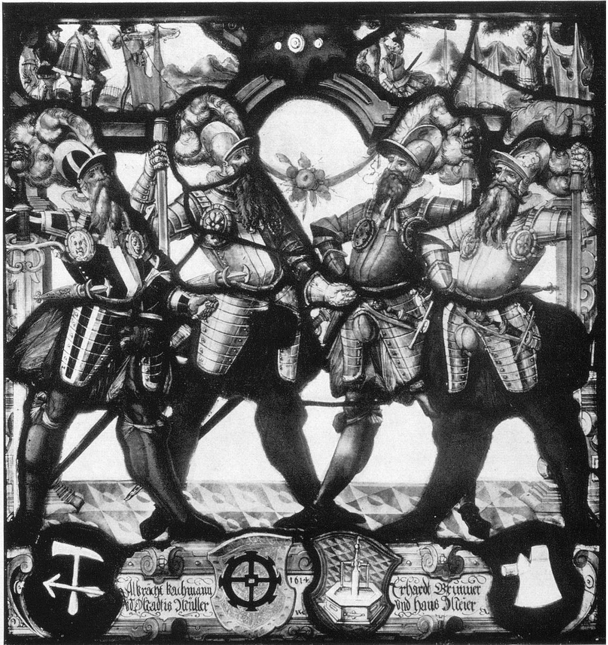
Die Vierer der «Zunft zum Grimmen Leuen». Wappenscheibe, 1614.

Schon 1506 wird der «Löw», 1512 die «Löwenstub» erwähnt. Auch in alten Kaufrodeln ist in Verbindung mit der näheren Ortsbezeichnung für andere Häuser 1525 von einer «Löwenstuben», 1592 von einem «Leuenhof» die Rede. Das Gäßchen, das zwischen dem ehemaligen Primarschulhaus (heute Firma Knecht) und der Liegenschaft Schläpfer zum Schäferhaus aus der Schmiedgasse zur untern Mauer führt, wird laut Waldvogel im Stadtbuch wenigstens einmal als «Löwenhofgäßli» bezeichnet. Es scheint somit ziemlich sicher, daß sich das alte Zunfthaus von Anfang an an der gleichen Stelle befand und mit dem in den dreißiger Jahren des