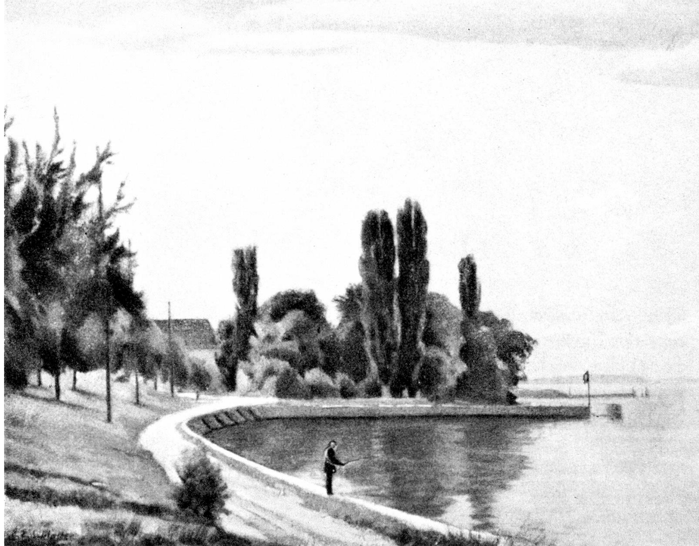
Angler bei Uttwil. Gemälde von Ernst E. Schlatter

unserer erst seit einigen Jahren angewandten Methode: Die Fischerrute wird am Bootsrand festgemacht. Am Ende des Nylonfadens hängt ein Bleigewicht von 250 bis 270 Gramm Gewicht, im Abstand von je etwa 2 Metern folgen vier oder fünf Seitenzügel, bestückt mit einem kleinen Felchenlöffel. Wir nennen diese Montage respektlos «Löligeschirr». Eine Stunde war ich nun schon mit dieser Ausrüstung umhergefahren, hatte verschiedene Tiefen abgefischt, aber die Rutenspitze bewegte sich nicht. Da, eine Kurzslußhandlung: Ich ließ der Schnur freien Lauf, bis etwa die Hälfte von der Rolle abgelassen war. Eine Nachkontrolle ergab, daß der unterste Löffel sich in einer Tiefe von 25 bis 28 Metern befinden mußte. Erfolg versprach ich mir von meiner Methode nicht. Kretzer mußte es in meinem bezogenen Revier geben, das wußte ich von meinen Sportkameraden. Doch wie erstaunt war ich, als nach kaum einer Viertelstunde die Rute sich langsam nach hinten bog, sich aber bald wieder streckte. Mein erster Gedanke: Sicher hast du einen «Hänger» am Boden mit Glück überstanden. Also fuhr ich etwas seeauswärts, und nun fing