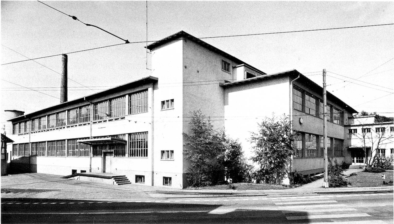
Hauptfront von Süden.

lassen zu haben, doch versucht man immer wieder, die Vorteile von Baumwolle und jene von Synthetics zu vereinen und zu optimalen Erzeugnissen zu führen. Jedenfalls ist eine gewisse Rückkehr zur Naturfaser festzustellen. Die rohen, rohbunten, glatten und schaftgemusterten Grob-, Mittelfein- und Feingewebe aus Baumwolle, Zellwolle, Synthetics und eben aus den Mischungen finden ihre Verwendung zu 50 Prozent in der Bekleidungsindustrie. Zu etwa 10 Prozent wird, mit Vorhangstoffen vor allem, für die Dekoration gearbeitet und zu etwa 20 Prozent für den Haushalt mit Bett- und Küchenwäsche; dazu kommen 20 Prozent gemischte Gewebe. Es gibt für diese Produkte auch Verwendung