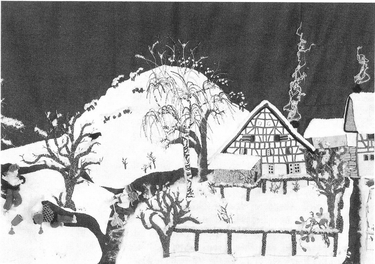
Mein Elternhaus im Winter, 1968.