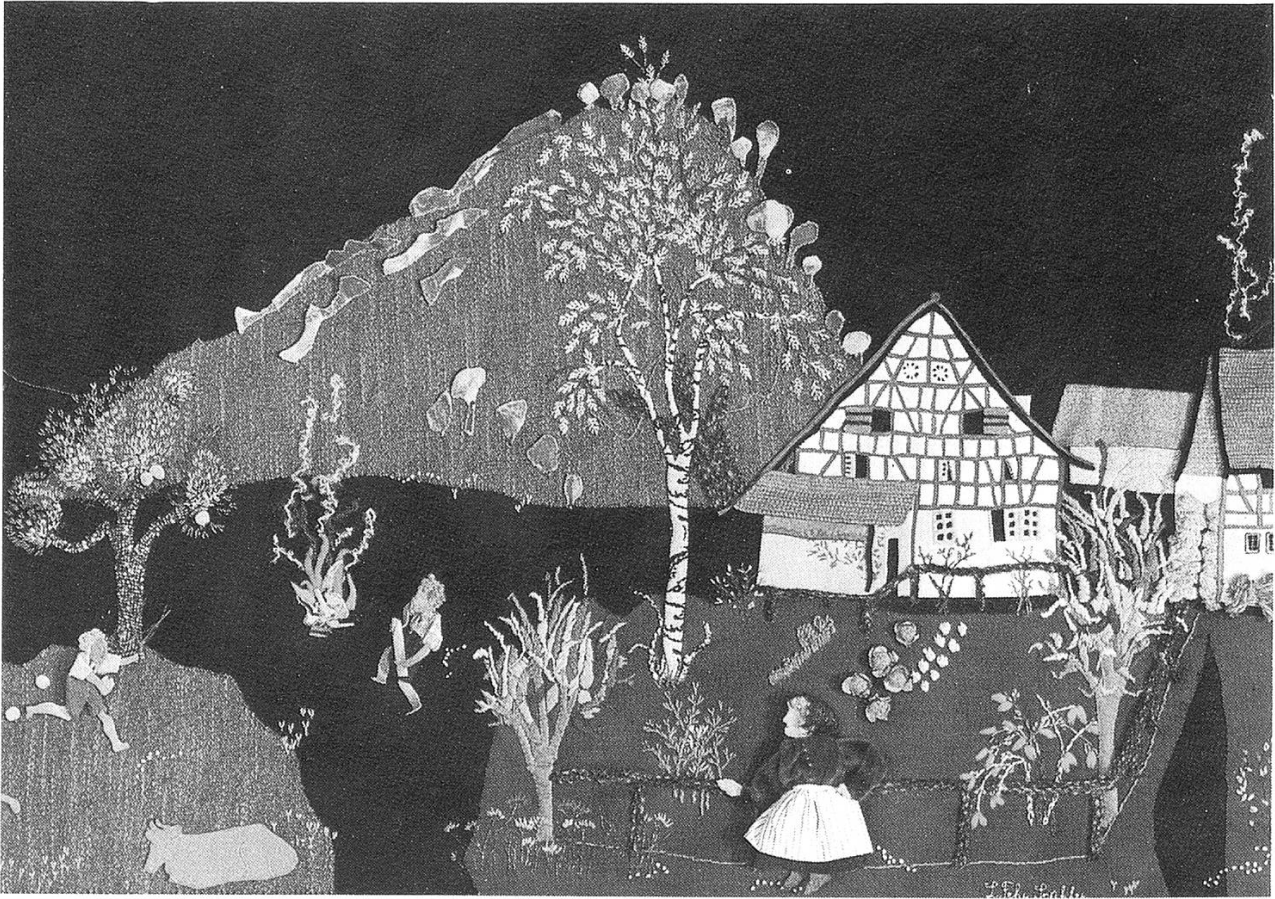
Mein Elternhaus im Herbst, 1967.