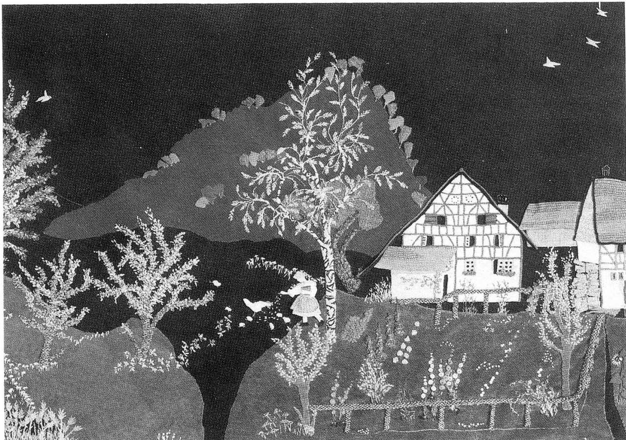
Mein Elternhaus im Sommer, 1969.