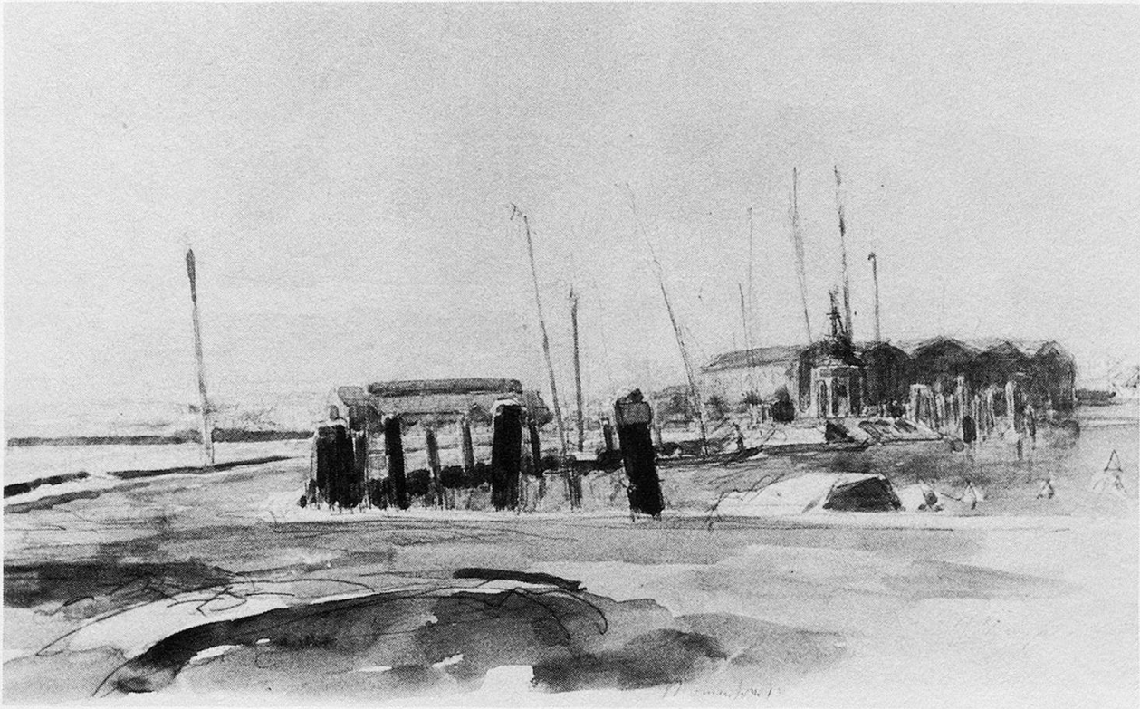
Romanshorner Hafen, Aquarell, 1952.