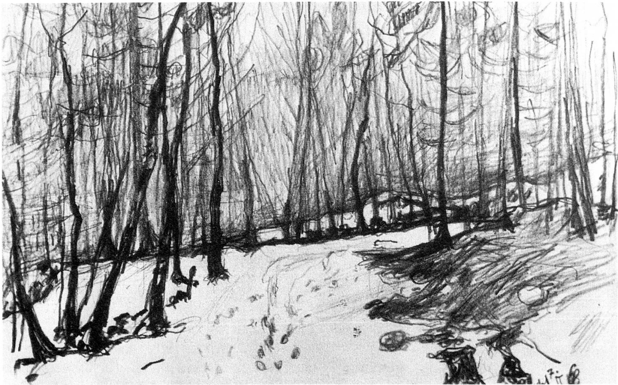
Winterwald, Bleistift, 1968.

treffene Meister des Aquarells in der europäischen Malerei spricht vom «angesammelten heimlichen Schatz des Herzens, offenbart durch das Werk und die neue Kreatur, die einer in seinem Herzen schöpft in der Gestalt eines Dings», und er betont, «daß ein Künstler in geringen Dingen mehr erzeugen könne, denn mancher in seinem großen Werk.»