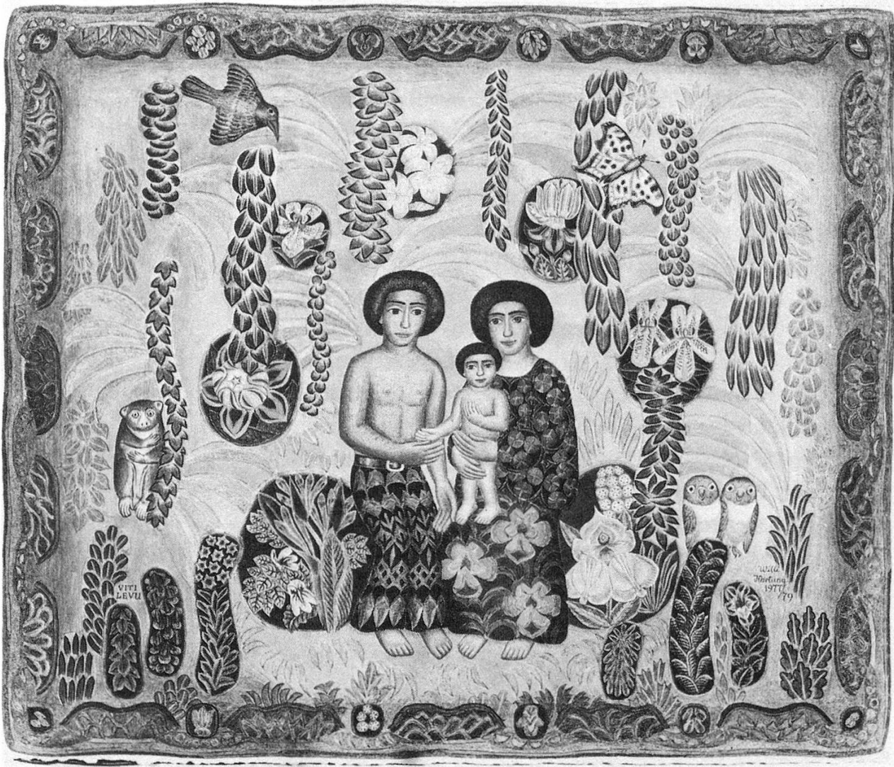
Familie auf Viti Levu, Aquarell