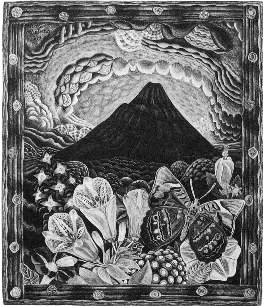
Der Popocatepetel, Aquarell