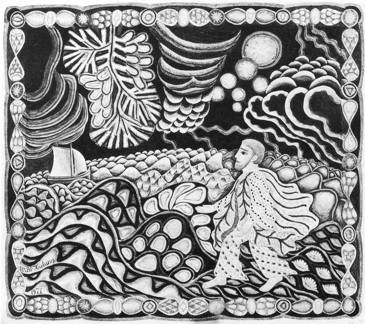
Jesus wandelt auf dem Meer, Aquarell

nen Flächen angelegt oder mit sorgfältigem Pinselzug abgesetzt, um den Kompositionen Struktur zu verleihen. Man könnte ihn vielleicht einen Primitiven nennen (obwohl dieser Begriff heute oft mißverstanden wird), in der Meinung, daß er ein Künstler ist, welcher die Konvention verlassen hat, um seiner schlichten Vorstellung von intuitivem Raum und Form zu folgen. Der wirkliche Primitive zeigt sich unbeeinflußt vom Drang zur Imitation. Er beschreibt, was er sieht, und spielt mit Mustern und Symbo-