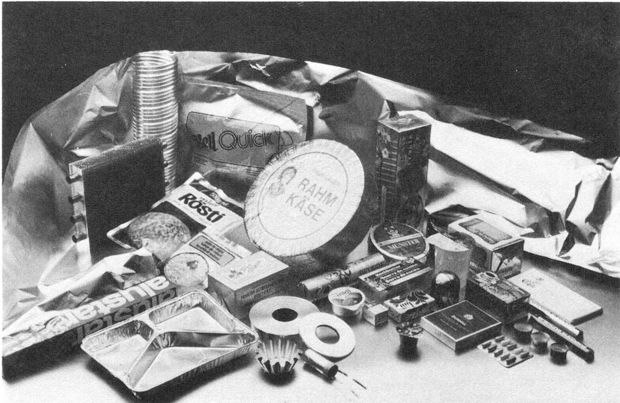
Anwendungsbeispiele von Aluminiumfolien

gestellt. Blanke Aluminiumfolien werden vor allem in der Elektroindustrie und als Verpackungs- und Isolationsfolien verwendet; als dünne Bänder dienen sie für Verpackungs- und technische Anwendungen. Veredlung der Folien kann erfolgen durch Lackierung, Flexo- oder Tiefdruck, Kaschierung oder durch (heute kaum mehr übliche) Prägungen. Lackierung dient dem Schutz der Folienoberfläche. Je nach Verwendungszweck dient der Lack auch als Haftvermittler für den anschließenden Druck, oder er verbessert die Gleiteigenschaft für schnellaufende Verpackungsmaschinen; er ermöglicht auch durch Heißsiegelung hermetisch geschlossene Packungen.