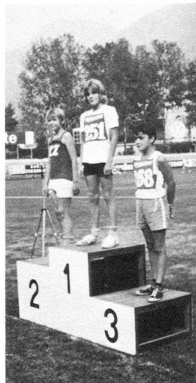
1972 Schweizer Meisterschaft in Lugano