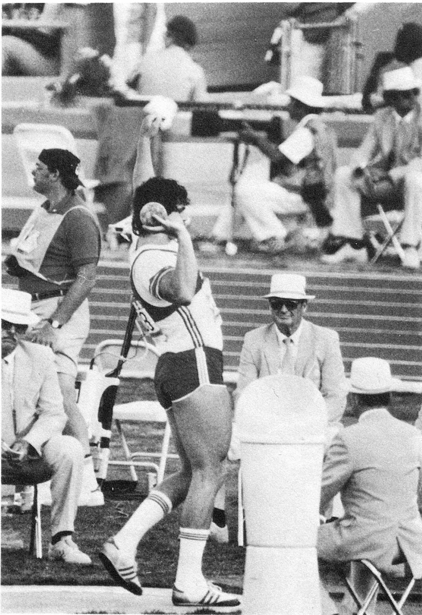
Olympiade Los Angeles 1984

zielen. Warten wir die EM 1986 ab, dann wissen wir mehr. Man muß auch berücksichtigen, daß im Kugelstoßen momentan die Europäer vorne liegen, mit Ausnahme einiger weniger Amerikaner.» Die Sache ist auf einen einfachen Nenner zu bringen: Werner Günthör zählt zu den Top-Ten auf der Welt.