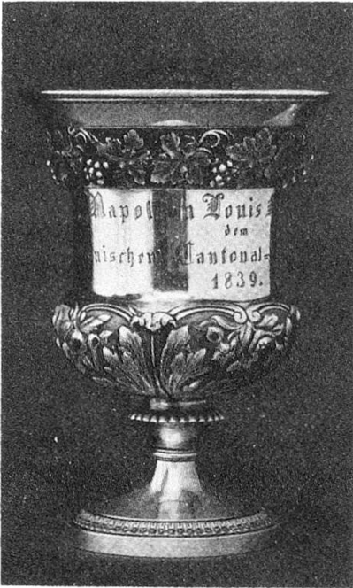
Ehrenbecher von Prinz Louis Napoleon Bonaparte