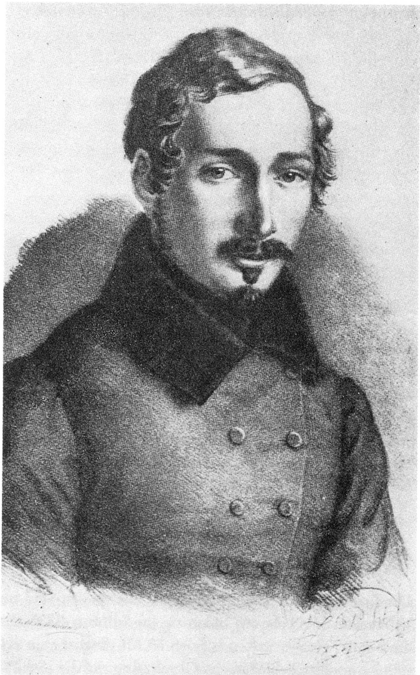
Prinz Louis Napoléon 1834 Nach Lithographie von Friedr. Pecht, im Wessenberghaus, Kon- stanz

leitete die jungen Salensteiner im Laufen und Springen an. Selber ritt, schwamm und focht er gern. Er besaß rund ein Dutzend Vollblutpferde und ging in den Wäldern des Seerückens auf die Jagd.