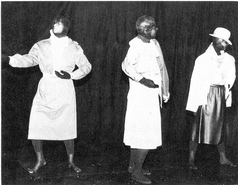
1 Seminaristinnen, zu Schaufensterpuppen erstarrt und in eigene Mode eingekleidet, anlässlich einer Patent-Feier.