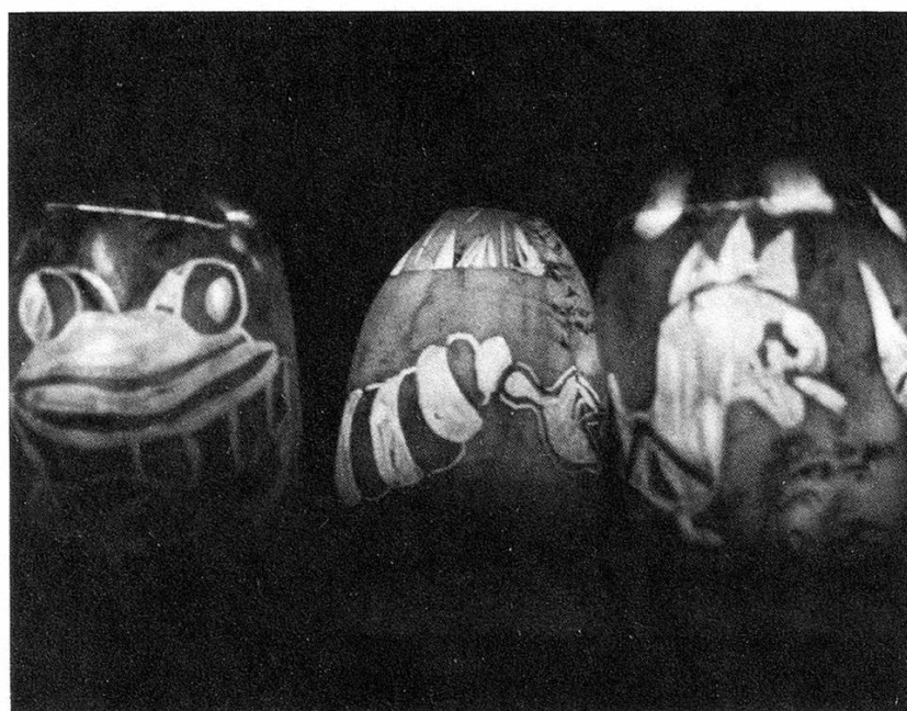
3 Weinfelder Bochslnacht: Runkelrüben werden zu «Bochseltieren».