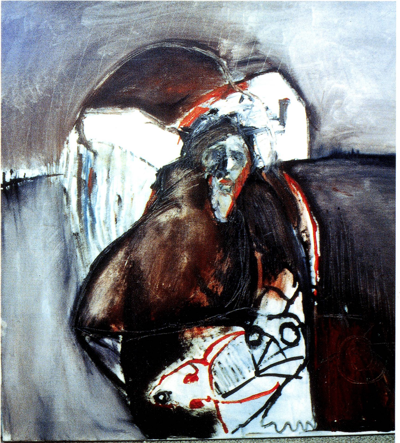
Öl 1m x 1m